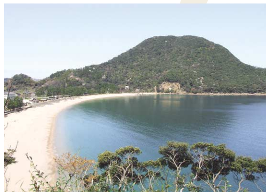
魚見台から望む訓谷湾。かつての山番小屋はもう少し上に建てられていた。魚見楼を建てて地引網をしたとする安永年間(1700年代)の記録も残っている。

小屋には2人の番人が海を見つめ、沖より魚群が近づくと、屋根に上がって白と赤の旗を振り、「オ