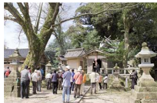
沖野神社とクヤキ。境内には灯籠が数多く奇進され、銘には京都の商人の名が見える。北前船の船主によるものだという。

●裏路地探検に参加してみませんか! 平成22年7月10日(土) 10:00~12:00 「黒川温泉周辺を歩く」朝来市生野町黒川 *実施日の10日前までに、18ページ掲載のT2編集部へ、住所・氏名・年齢・電話番号・「裏路地参加希望」とお書きの上、ハガキでお申し込みください。開催は午前中、現地集合・現地解散となります。申込締切日後、案内を参加ご希望の方へ送付致します。