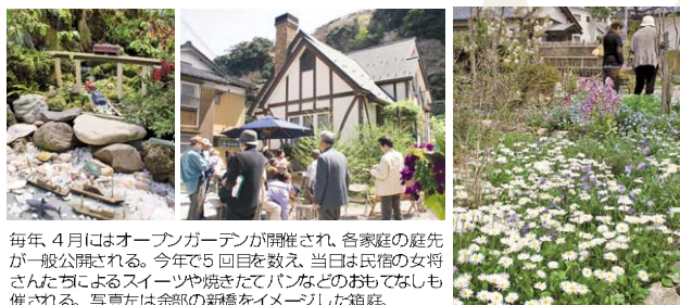
毎年、4月にはオープンガーデンが開催され、各家庭の庭先が一般公開される。今年で5回目を数え、当日は民宿の女将さんたちによるスイーツや焼きだてパンなどのおもてなしも催される。写真左は余部の新橋をイメージした箱庭。

白砂青松の穏やかな海岸美が広がる訓谷浜。クロマツやケヤキの巨木、色とりどりの花々、人情味あふれる人々が旅人を優しく迎える。