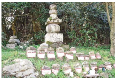
沖野神社の裏側に立つ石造五輪塔は県の文化財に指定されている。南北朝時代のもので、欠損部が少なく、保存状態がよい。五輪のそれぞれの面に空、風、火、水、地の文字が刻まれ、戦国の世に散った人々の霊を祀っている。