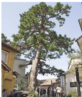
県下一とされる人クロマツ。50年ほど前には数百年生の松が何本も生い茂っていた。