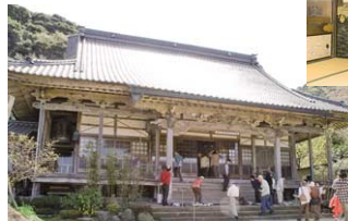
浄土真宗の古刹・光永寺には蓮如上人の真筆が掛け軸に残されている。また、本堂の両脇には訓谷湾を描いた襖絵がある。境内の八房梅の老木は人変貴重なものとされている。

側に茂る大クロマツは樹齢約400年、幹周りが49.6センチもあり、『ひょうごの巨樹・巨木100選』に選定されている。 また、沖野神社境内に立つ大ケヤキも『但馬の巨木100選』に選ばれた巨木。樹高21メートル、幹周り5.3メートルを誇っている。 村の氏神である沖野神社は、後醍醐天皇ゆかりの神社。鎌倉後期、隠岐(島根県)に流された天皇は3体の尊像を海に流したとされ、その1体が現在の佐津地区公民館が立つ場所に漂着したと伝わる。以来、祭神として祀られたという伝承が語り継がれている。 境内には他に明治29年に建てられた芝居堂が現存。農閑期に村芝居が演じられ、現在も10月1日の秋祭り宵祭には、若手会による芝居が続けられている。宵祭と翌日の本祭には町の無形民俗文化財である「二番叟」を奉納。9月に入ると、小学生の踏子3名と中学生4名が、毎夜練習に励むそうだ。 伝統を守り続ける訓谷の人々。最近では4月にオープンガーデンが開催され、花による景観づくりも積極的に行われている。地引網で培われた連帯感がそうした街づくりに役立っているのかもしれない。