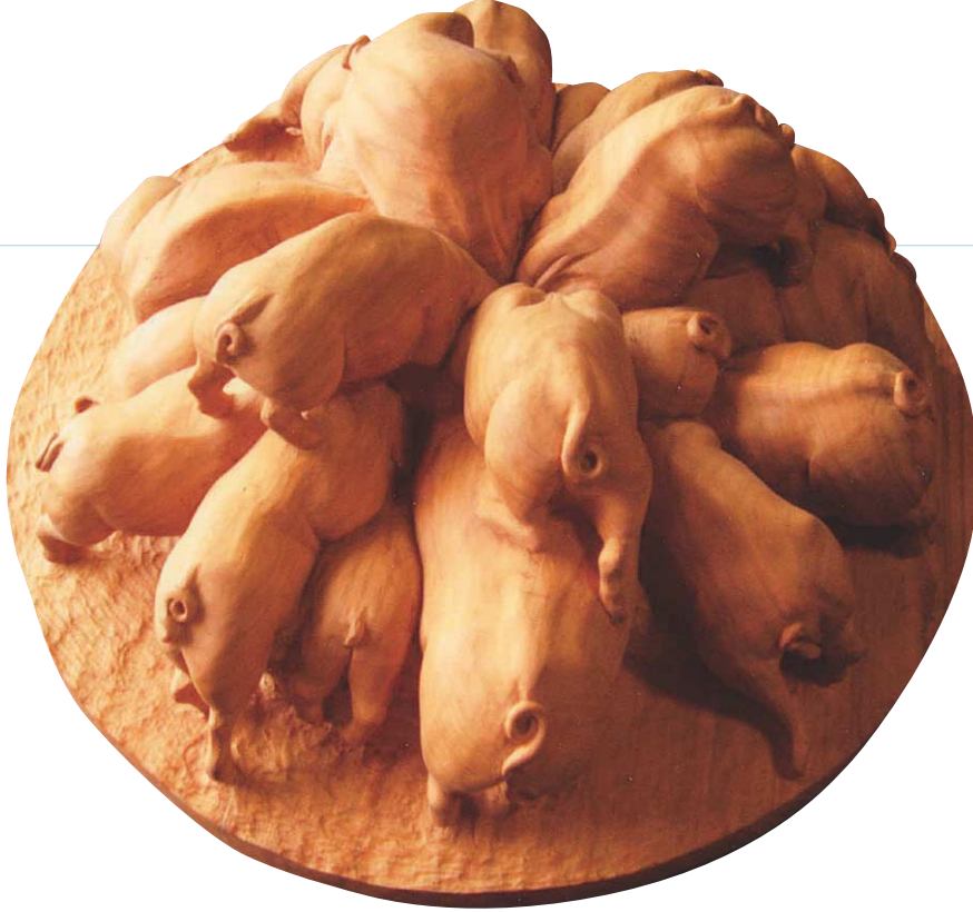
「食べ盛り」2006年 第13回木彫フォークアートおおよ受賞作品