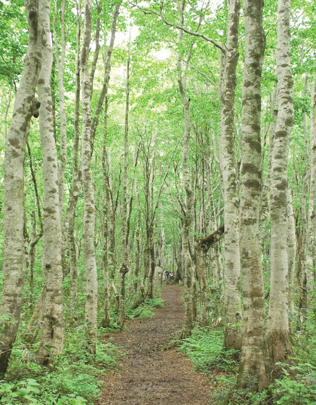
爽やかな風が吹き抜けるブナの小径では思わず深呼吸したくなる。