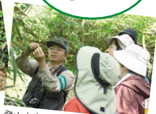
登山大会ではガイドさんが案内してくれるので、たくさんの発見がある。