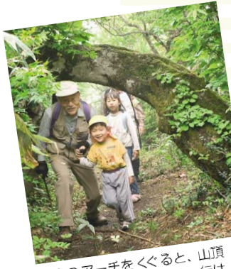
倒木のアーチをくぐると、山頂へ到着。お孫さん連れの一行は鳥取県側からの登山者。