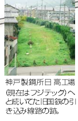
神戸製鋼所日高工場(現在はフジテックへと統括した旧国鉄の引き込み線跡)

●裏路地探険に参加してみませんか! 平成22年1月23日(土) 10:00~12:00 「与布土周辺を歩く」朝来市山東町与布土 *実施日の10日前までに、18ページ掲載のT2編集部へ、住所・氏名・年齢・電話番号・「裏路地参加希望」とお書きの上、ハガキでお申し込みください。開催は午前中、現地集合・現地解散となります。申込締切日後、案内を参加ご希望の方へ送付致します。