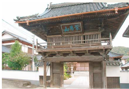
戦国武将・加藤清正を祀っていることで知られる立光寺。現在の本堂は延享3年(1746)の建立で、鐘樓門はそれから10年後に建てられたものと伝わる。日高夏祭りの原点である「清正公祭り」は、約150年の歴史がある。