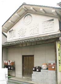
白壁が美しい西海商店さんの古い土蔵