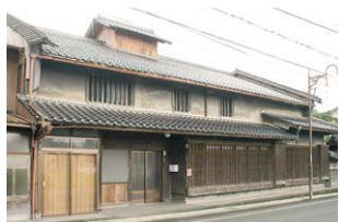
立派なうだつを掲げた旧日田口酒造の表玄関。格子戸や虫籠窓などが往時の様子を伝える。