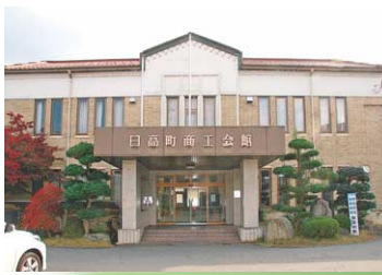
日高町商工会館は、昭和10年(1935)建設のモダンな建物。昭和57年まで役場庁舎として使用されていた。

728年創建と伝わる荒神社。江原周辺の土地を開いたと伝えられる飛田匠高生(ひだのたかたか)の祖父・荒人(あらひと)を祀っている。この地を「善原(えほら)」と讃えたことから、「江原」という地名が付いたとの伝承が残る。