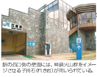
駅の西口側の壁面には、神鍋火山群をイメージさせる石持(れきぎ)が用いられている。