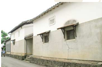
旧街道沿いに面する友田酒造の酒蔵扉。文政13年(1773)の創業で、銘酒「雪之梅」などを販売している。この辺りには製米工場やかまぼこの原料となるでんぷりを作る工場があった。