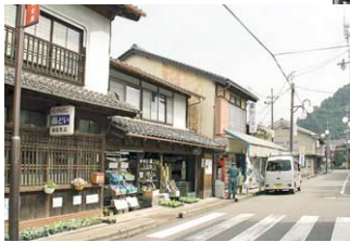
神鍋行きのバスが行き交った西ノ気通り。所々に古い行末を見せる商店が残る。

旧日高町の商業中心として栄えた江原駅周辺 人や物が絶えず行き交う交通の要衝であった 通りに刻まれた名が往時の様子を今に伝える