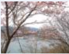
山頂からの諸寄港

国道からのアクセスがよい浜坂城山(標高170m)は、室町時代この地を治めていた塩治(えんや)周防守の芦屋城址でした。中腹までのドライブウェイは春の桜並木が素敵です。駐車場より山頂まで10分あまりとお手軽散歩道。頂上からの景観は周囲を海と断崖に囲まれ、戦国時代に但馬水軍が海上交通を抑える要所であったことを実感できます。眼下西には、江戸～明治期に北前船の風待ち湊として賑わった諸寄港が見渡せ、また夕陽の美しさも格別です。