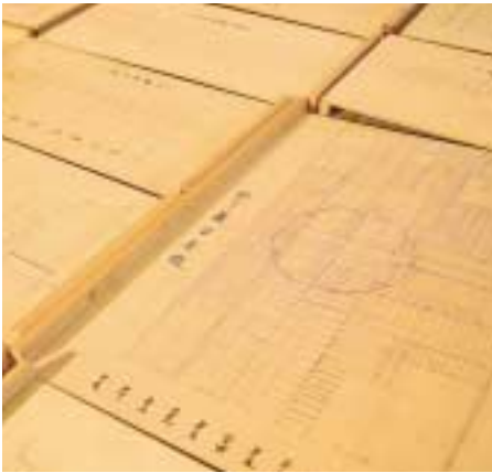
取り外した部材は細かく図面へナンバリングされた。