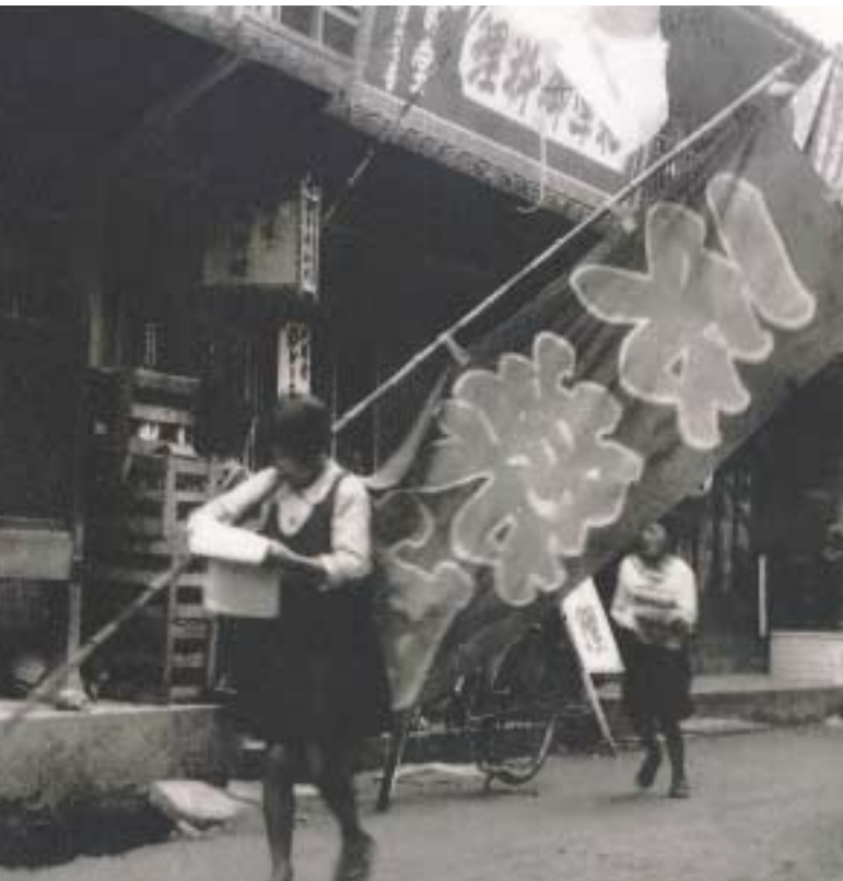
かつては子どもたちも興行のどらを配って回った。