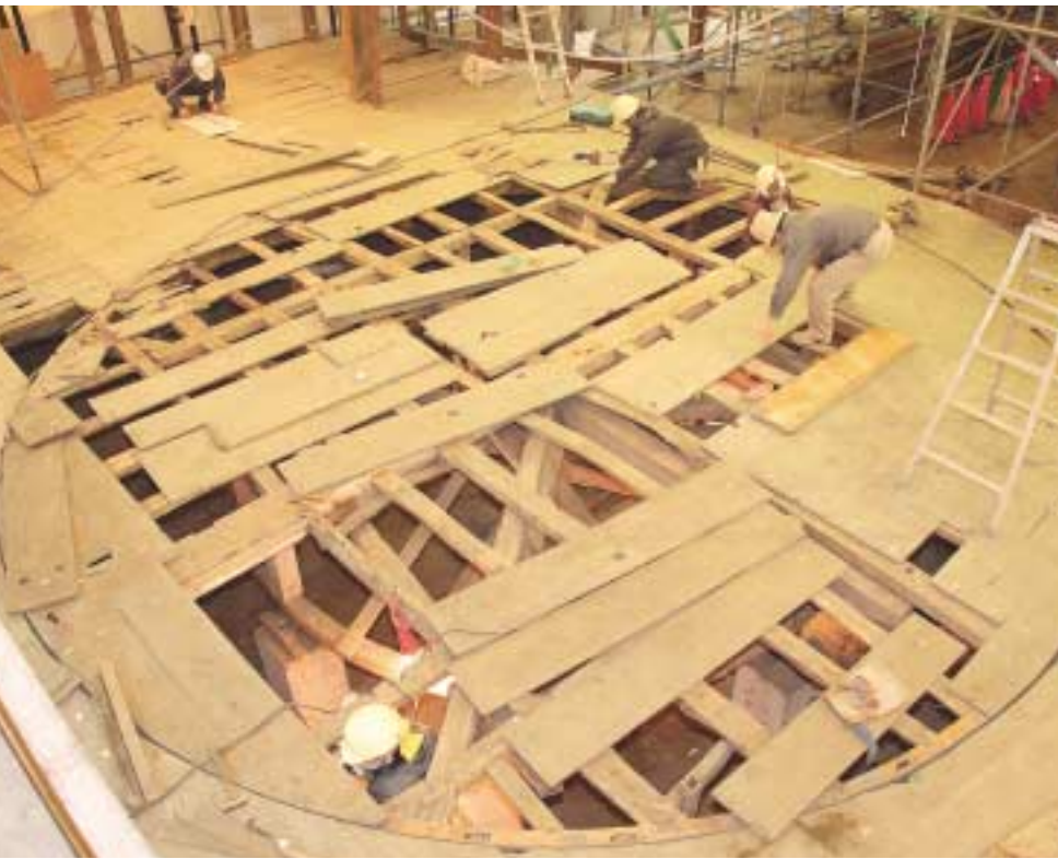
回り舞台の修復の様子(左)・看板も色を塗り直し、鮮やかに復元された(右)