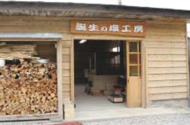
誕生の塩工房。昔、竹野の子供は塩で大きくなったのだとか。

～誕生の塩工房 DATA～ *大人1,500円、小人900円 *要予約(3日前まで) *10時～11時30分・13時30分～15時 (間)たけの観光協会 TEL0796-47-1080 *豊岡市竹野町竹野17-12(たけの観光協会)