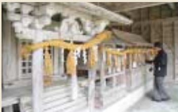
町の文化財に指定されている人放(おほなち)神社(左)。十二社神社の末社で、鎌倉末期の建立といわれている。10月5日には麒麟獅子舞が奉納される。境内のシイの巨木は根のこぶが異事で、年輪を感じさせる。