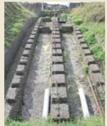
港から駅までを結ぶ魚類運搬車軌道跡。ケーブルでつながれた台車が魚を運び、列車で出荷されていった。