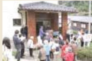
元は小学校だった公民館前で説明を聞く参加者の皆さん。玄関前は校庭として子供たちが遊んだとか。

海を見下ろす駅として全国でも稀少なJTB鎧駅。JTBのボスターもロケ地として使用されることが多い。車窓に映し出される風景は、爽快の一言。