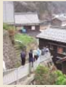
焼き板の壁を縫うようにして、細い路地が入り組んでいる。くねくねした道が心地いい。