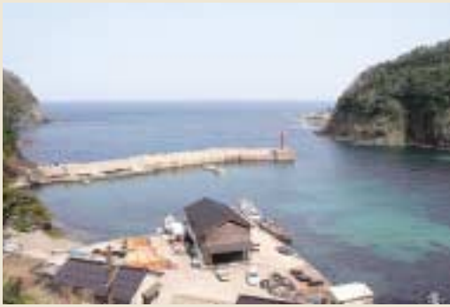
鎧駅から日本海、漁港を望む。鎧漁港は天然の良港として重宝され、昔から漁業が盛んだった。西側は護岸工事がされているが、東側は住民の依頼により、昔のままの火山岩の岩肌が残されている。

途中の斜面に現れるコンクリートで固められた2本のくぼみは、港の繁栄ぶりを示すもの。水揚げされた魚を駅まで運ぶために使われたケープル跡で、昭和26年頃に建設された。最盛期には三日三