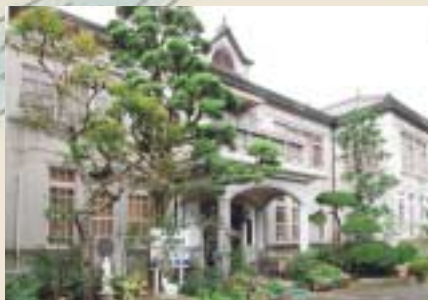
古い町並みの中で、ひと際目立つ洋館建ちのモダンな医院。玄関を中心として、左右対称にデザインされている。昭和5年の建設で、一度も改築されていないという。屋根中央には、換気窓が設置されている。