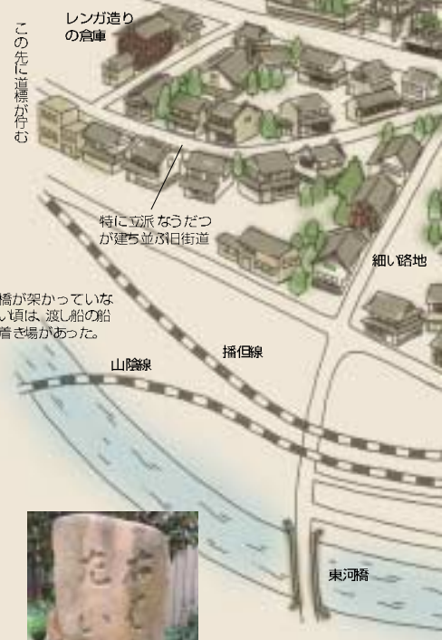
この先に道標が付む