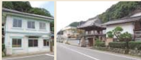
(右)和田山の環の中心に位置する圓龍寺。但馬最古の白鳳期の金銅仏を所蔵する。また、水難者を供養するため、家族から寄進された一刀彫りの地蔵尊が数多く安置されている。(左)圓龍寺の隣りにある擬洋風の公民館。明治期に建てられた古い建物である。