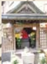
町内六ヶ所ある地蔵尊