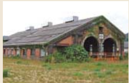
和田山駅のホームから見えるかつての機関庫。明治44年、播但線と山陰線の接続駅となったことにより、翌45年、機関庫と給水塔・転車台、引き込み線などが建設された。平成3年頃まで、現役として活躍したが、現在は老朽化のため、中は立入禁止となっている。全国的にも珍しいレンガ造りの機関庫で、半円型の入口部には、白御影石が用いられている。