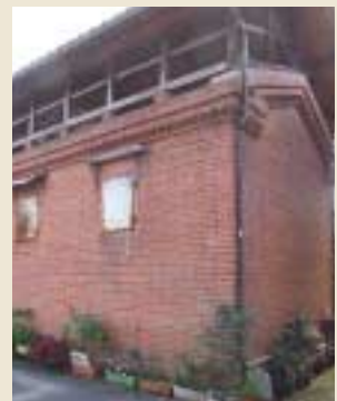
旧街道沿いの路地にあるレンガ造りの倉庫。町屋風の建物が多い中で、異彩を放っている。機関庫のレンガで造られたともしわれているが、定かではない。