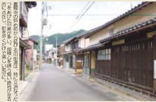
圓龍寺の斜め前から延びる旧街道は、特に立派なうだつをあげた町家が多い。漆喰の土壁、虫籠窓、うだつをあげる立派な町家が至る所に点在し、町を歩くと楽しい気分。

圓龍寺から斜めに延びる道は、旧街道。今でも漆喰の土壁、虫籠窓、うだつをあげる立派な町家が