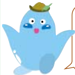
「円山川」イメージキャラクター「ぶるん」