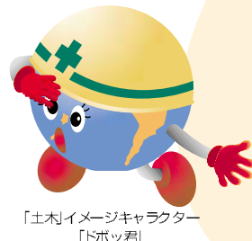
「土木」イメージキャラクター「トボックリ」