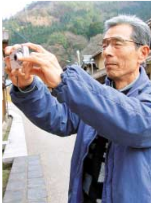
自分の視点を意識した写真を必ず撮るのが、取材ポリシー。「気軽に楽しく、但馬の元気・新鮮情報を発信」をテーマに、駆け回っている。

デジカメを片手に、但馬をところ狭しと走り回る特派員たち。(財)但馬ふるさとづくり協会のホームページ「但馬情報特急」のコーナーである「但馬ふるさと特派員だより」が、活動1周年を迎えました。現在、18名の特派員が、但馬の歴史や文化などの情報をブログで発信しています。メンバーは、「但馬ふるさとづくり大学」ITゼミの受講生が中心。第一回目の講義で、講師が発した突拍子もない一言が、このグループを作るきっかけとなりました。 「パソコン操作は教えません。但馬放送局を作り、快適・便利・愉快な但馬を発信しましょう」。この言葉に受