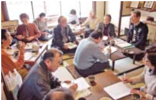
※ブログ：日々更新される日記的なホームページの総称

月1回の例会では、活動についての意見交換や勉強会などを開催。お互いの経歴なども知らないで、毎回、気兼ねのない自由なトークが展開されている。