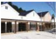
蔵をイメージした外観

養父市八鹿町高柳の国道9号沿い、道の駅「ようか但馬蔵」の地域交流ゾーンがプレオープン!施設内には、農産物直売所・レストラン、足湯などがあります。情報ターミナルゾーンを含めたグランドオープンは、来年3月の予定。災害時には、「防災拠点」の役割も果たします。