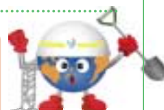
「土木」イメージキャラクター ドボッコ

兵庫県内の一般国道9号では、12月から3月までの期間を雪害対策実施として、円滑な道路交通を確保するため、迅速かつ適切な除雪活動を行います。