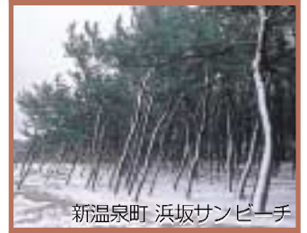
新温泉町 浜坂サンビーチ