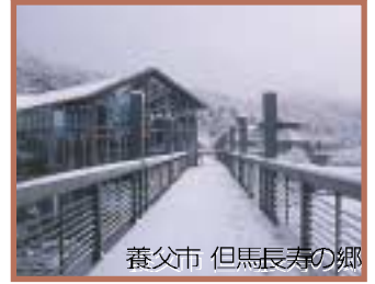
養父市 但馬長寿の郷

T 2いつもとても楽しみにしております。中でも、「コウノトリ」はいつも関心を持っており、離れていてもいつも気にかけています。但馬へ足を運んだ際、但馬へ寄せてもらった際に、「気長に見守ってやって下さいね」と声をかけて帰るようになっています。ヒナをトンビが襲ったのは、ショックで、大事に見てやるのが大切だと感じました。