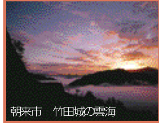
朝来市 竹田城の雲海