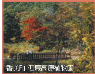
香美町 但馬高原植物園