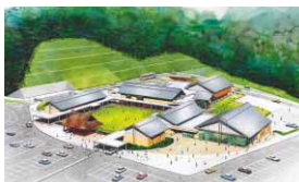
春日和田山道路・山東PA(道の駅)は、今年兵庫国体までに完成予定！埋蔵文化センターが隣接する。

また、「春日和田山道路」の開通に伴い、道の駅「但馬のまほろば(山東PA)」もオープン予定！古墳時代の古代政庁をイメージした施設は、但馬地域の歴史文化の交流拠点として活躍が期待されています。