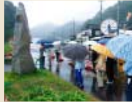
歌碑の説明を聴く参加者の皆さん