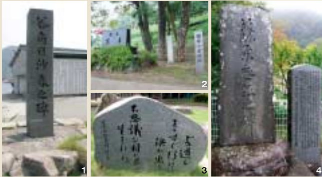
1. 谷角日沙春記念碑 2. 諸寄小学校創立百年碑と小学校跡碑 3. 第2回前田純孝賞受賞歌碑「どの道もまっすぐ行けば河に出る 不思議な村に君は生まれる」 4. 諸寄駅にある篠原無然記念碑