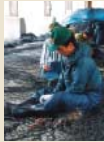
雨降り、港で網を繕う漁師さん