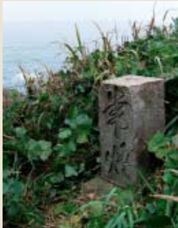
長年港を見守ってきた常燈の一部。「常夜燈」より古い言葉であることから、江戸時代のもと考えられる。