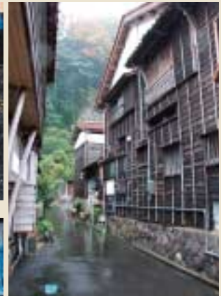
路地に入ると焼き板の家々が軒をつらねる。江戸時代は宿場が多かったそうだ。