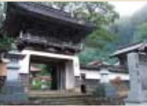
純孝が眠る龍洞寺は、曹洞宗の修行寺として知られ、多くの高僧を輩出している