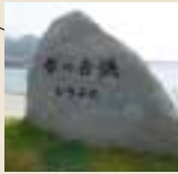
花崗岩質を含む砂浜は「雪の白浜」と称され、古くは西行法師の歌にも登場する