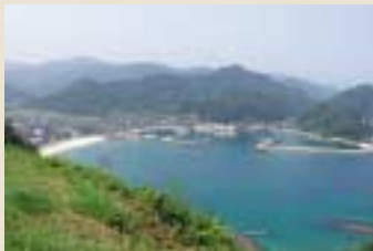
東の岬、城山園地からは諸寄が一望できる