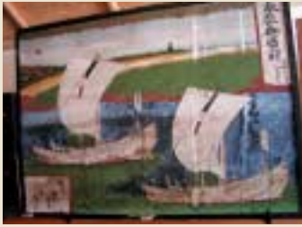
八坂神社の「幸神丸船絵馬」には、絵師・吉本善京の落款が入っている。当時、落款入りのものは特に高価だったという。

西側の岬は日和山と呼ばれ、昔はここに立つて天候を予測したという。高台にある諸寄港日和山灯台の傍らには、廻船の道しるべとなった常燈(灯明台)の一部が今も