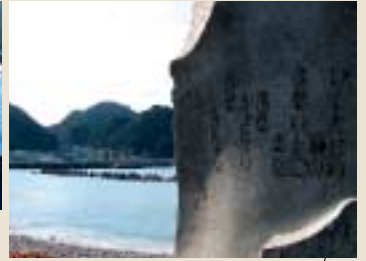
立派な一枚岩を使った諸寄海岸の純孝歌碑