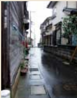
民家と民家の間に張り巡らされた細い路地は浜へと通じる