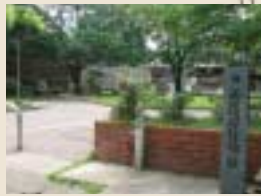
旧西浜村役場跡には第2回前田純孝賞受賞歌碑が建立されている

●裏路地探検隊員募集 平成18年1月21日(土) 「朝来市新井周辺を歩く」 *実施日の10日前までに、18ページ掲載のT2編集部へ、住所・氏名・年齢・電話番号・「裏路地参加希望」とお書きの上、ハガキでお申し込みください。開催は午前中、現地集合・現地解散となります。申込締切日後、案内を参加ご希望の方へ送付致します。