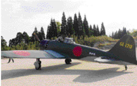
本物そっくりな零戦