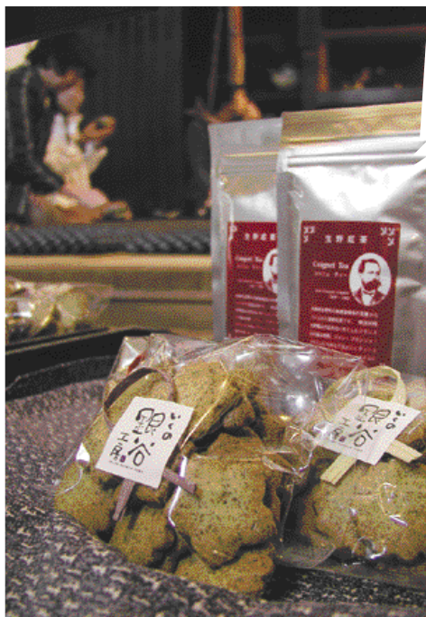
生野まちづくり工房「井筒屋」では来館者にクッキーやお茶が振る舞われる