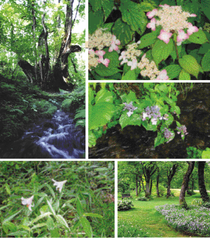
(左上)但馬高原植物園のシンボル「和池の大カツラ」 (左下)この時期はササユリをはじめ、ヤマアジサイなどが見頃を迎える

協力：但馬高原植物園 大人500円、高校生400円、小中学生100円。9～16時。