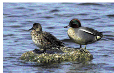
円山川にたたくむコガモ