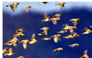
大群で移動するアトリ

「チュリン、チュリン」と甘い鳴き声で鳴くのはオオジュリン。ヨシ原やススキなど草丈の高い場所を好み、円山川河川敷は最適な生息場所です。ホオジロと似ているため見間違われることがよくありますが、その甘い声を聞けば、オオジュリンだとすぐに判別できます。10月下旬くらいから飛来し4月下旬くらいまで見られ、小春日和のアシ原の主役です。