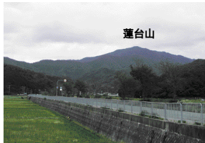
蓮台山 矢印の部分は旧道の頂上付近