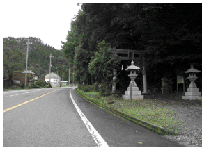
峠を越えて久谷に出ると、ふもとに現在の八幡神社がある

「煮炊きに行く人のみ、山を登ることはあつても、峠を越えて久谷に出ると、ふもとに現在の八幡神社がある。山を登ることはあつても、峠を越えて久谷に出ると、ふもとに現在の八幡神社がある。」