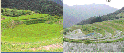
棚田の四季 季節ごとに新しい表情を見せてくれる。7月頃は元気に伸びる稲の緑が美しい。稲刈りは9月頃。

平成11年7月、農林水産省認定「日本の棚田100選」のひとつに村岡町和佐父西ヶ岡の棚田が選ばれました。兵庫県下で選ばれたのは、加美町岩座神、佐用町乙木谷、美方町うへ山、そして村岡町和佐父の4カ所。 棚田の定義とは山地や丘陵地などの斜面に階段状にひらかれていく水田のこと。斜面1ノ20(20m進んだときに1m上がる斜面)以上の斜面にある水田でないと選ばれません。全国に13882カ所、901市町村にあるといいますが、棚田面積221067haで、全国の水田面積270万ha(1997年調べ)の8%に当たるとか。