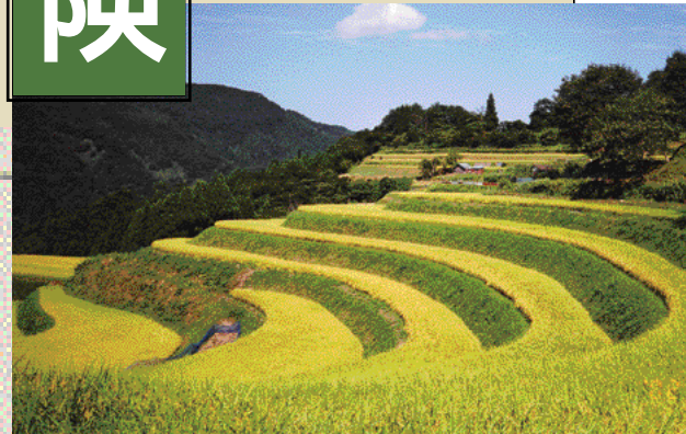
黄金色に実った稲刈り間近の棚田