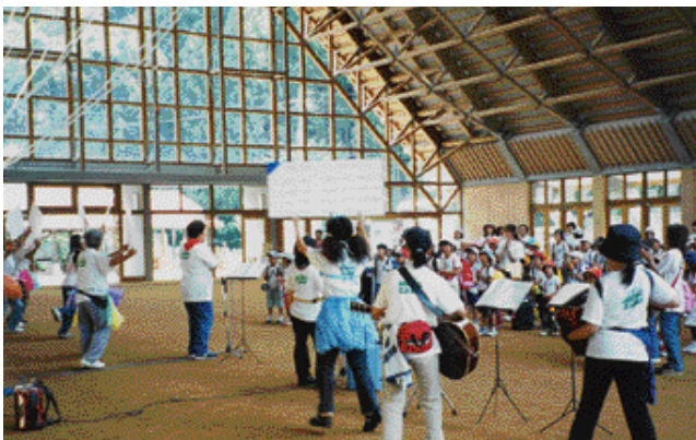
カワイミュージックキャンプ