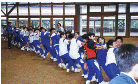
神戸大学発達科学部附属住吉中学校の新入生オリエンテーリング