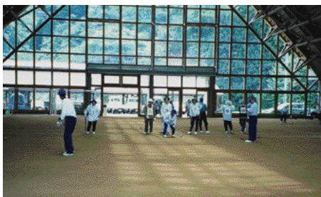
大屋町内ゲートボール愛好家の皆さん