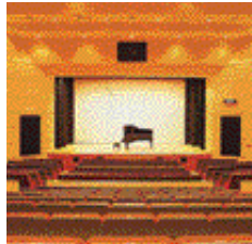
関宮町中央公民館