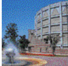
和田山町文化会館