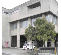
香住町中央公民館