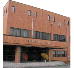
日高町文化体育館