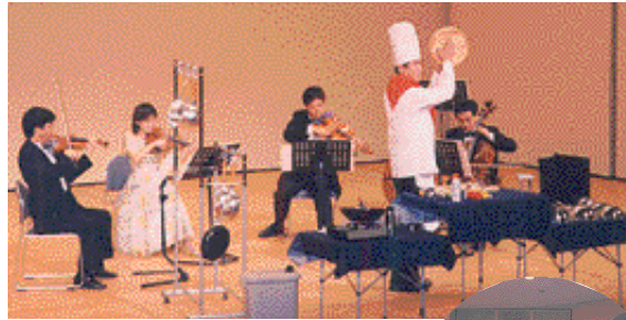
ライツ・チェンバープレイヤーズ ゆかいな楽しい音楽会(出石町文化会館)