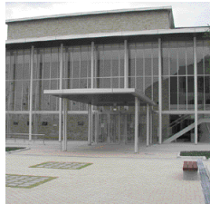
朝来町ささゆりホール