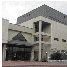
養父町ビバホール