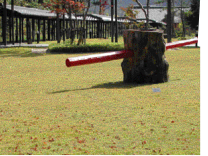
昨年の遊戯出合いのあーと展

大豆の収穫と 味噌づくり体験教室 11月10日(日) 10:30~15:30・20名 1,000円(弁当代など) 11/5申込締切