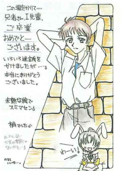
朝来町 / こそPさん

◆心ない人によって近所の野良猫が殺されました。ここ但馬でも目をおうひどい虐待事例が数多くあります。「いらなくなったから捨てる。目ざわりだから殺す」という、命を粗末に扱う人が横行する社会は人間の弱者に対しても優しいとは思えません。そんな中で不幸な猫を見過ごせず、エサを与え馴らし、避妊手術を受けさせている人があちこちにいます。そのおかげでゴミ置き場が荒らされなくなつた例はいくつもあり、この人たちの活動が数年続く内に不幸な猫が減るので、その地域では気持ちの良い人間関係が生じています。