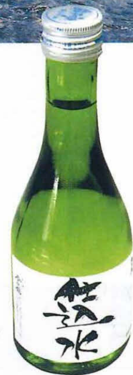
参加者に配られた酒の仕込水。一口飲んでみんなうまいと声をあげた。