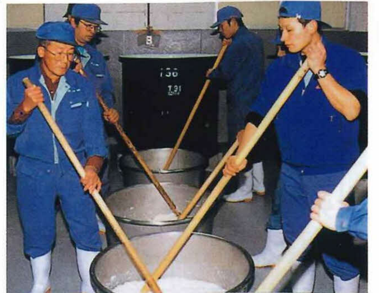
日本酒は世界に誇る伝統技術。美しい水とおいしい米からつくられます。