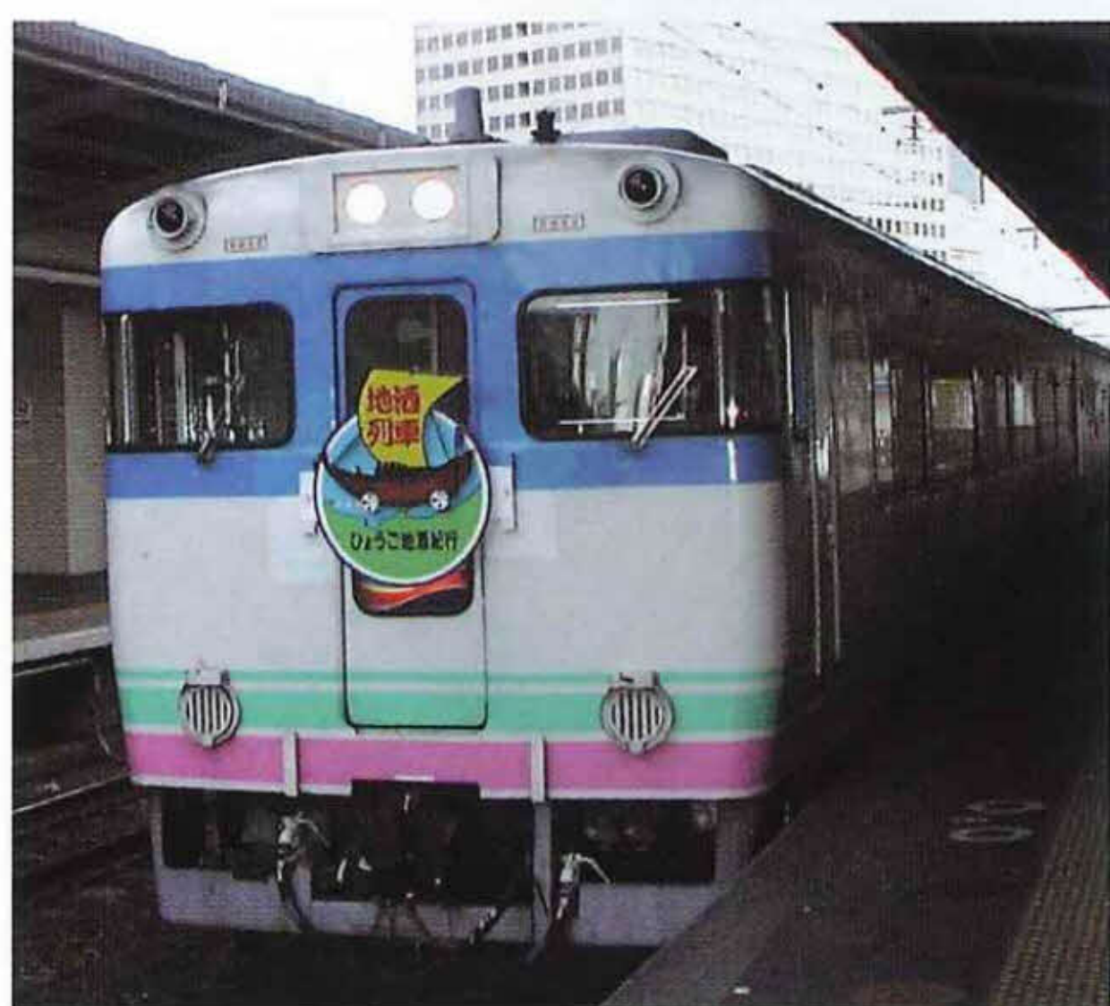
大阪駅を出発する地酒列車「ひょうご地酒紀行」

また、地酒列車「ひょうご地酒紀 行」が大阪駅から香住駅の間を約70 人の乗客を乗せて走りました。地酒 列車には兵庫の地酒(兵庫五国酒蔵 之会提供)として5銘柄、但馬の地酒 (北兵庫酒造組合提供)8銘柄の日本 酒が用意され、ゆったりと飲み比べを 楽しみました。特産である紅ズワイ ガニや赤イカの刺身、黒豆の枝豆、松 茸弁当、二十世紀梨なども配られ、 地元の産物を肴に日本酒ともども地 域の味も堪能しました。