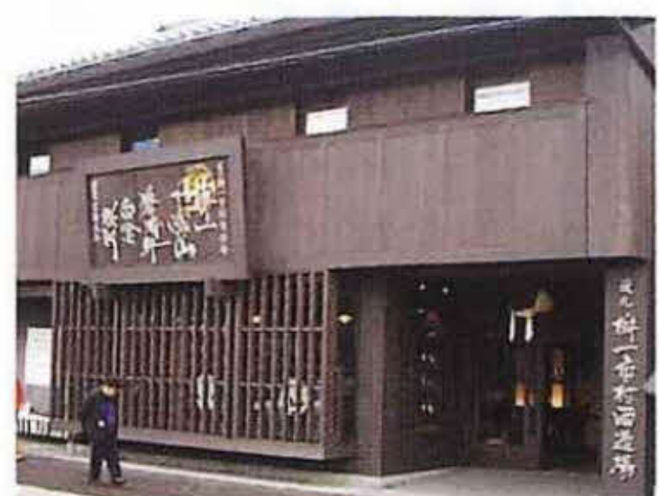
長野県小布施町にある榎一市村酒造場

酒づくりを取り巻く環境は急激な 変化を見せ、杜氏・蔵人の高齢化・減 少化、季節労働形態の崩壊、消費者 の趣向の変化など、全国の酒蔵がひ とつふたつとなくなっていく危機的状 態に陥っていました。そのような時代 背景の中、昭和61年、富山県西福光 町の成政酒造(株)は「酒蔵トラスト」 (有志の会員がお金を出し合って、そ の基金をもとに、ある酒蔵に日本酒 を造ってもらうシステム)第1号とし て成功しました。思うように酒が売 れないという悩みを抱えていた成政