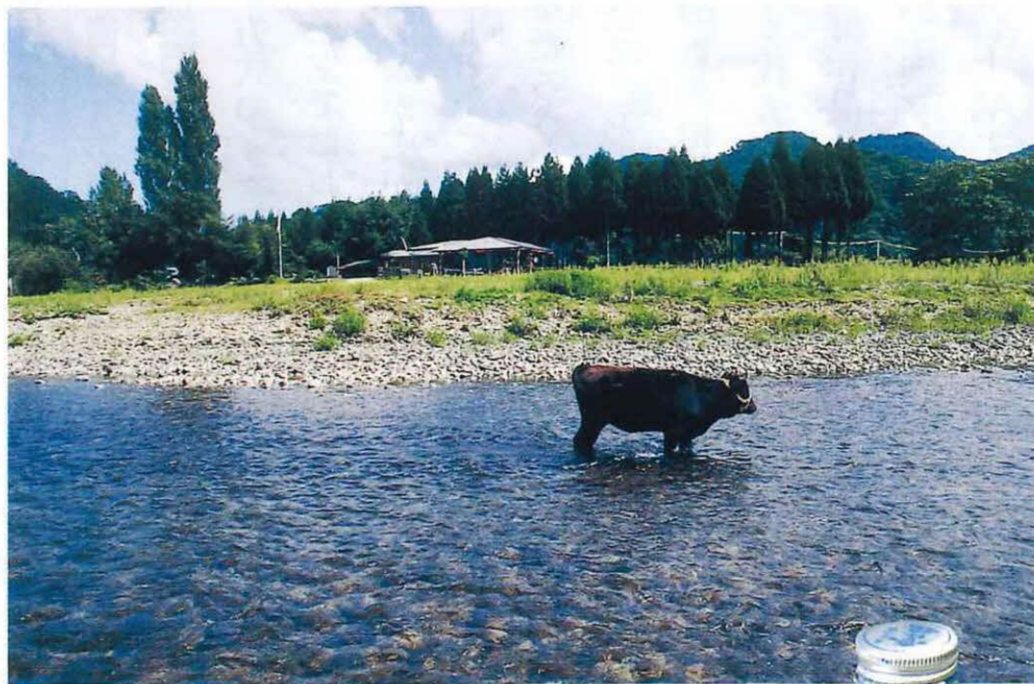
うまい酒をつくり出すきれいな川・矢田川

た。酒蔵を大事にすることは、環境をも大切にすることであると考えるからです。酒蔵が元気でおいしい酒を造っている町は、町自身も元気で健康である証ともいえるのです。酒蔵を守っていくことは、自分たちの町や文化を守っていくことではないでしょうか。