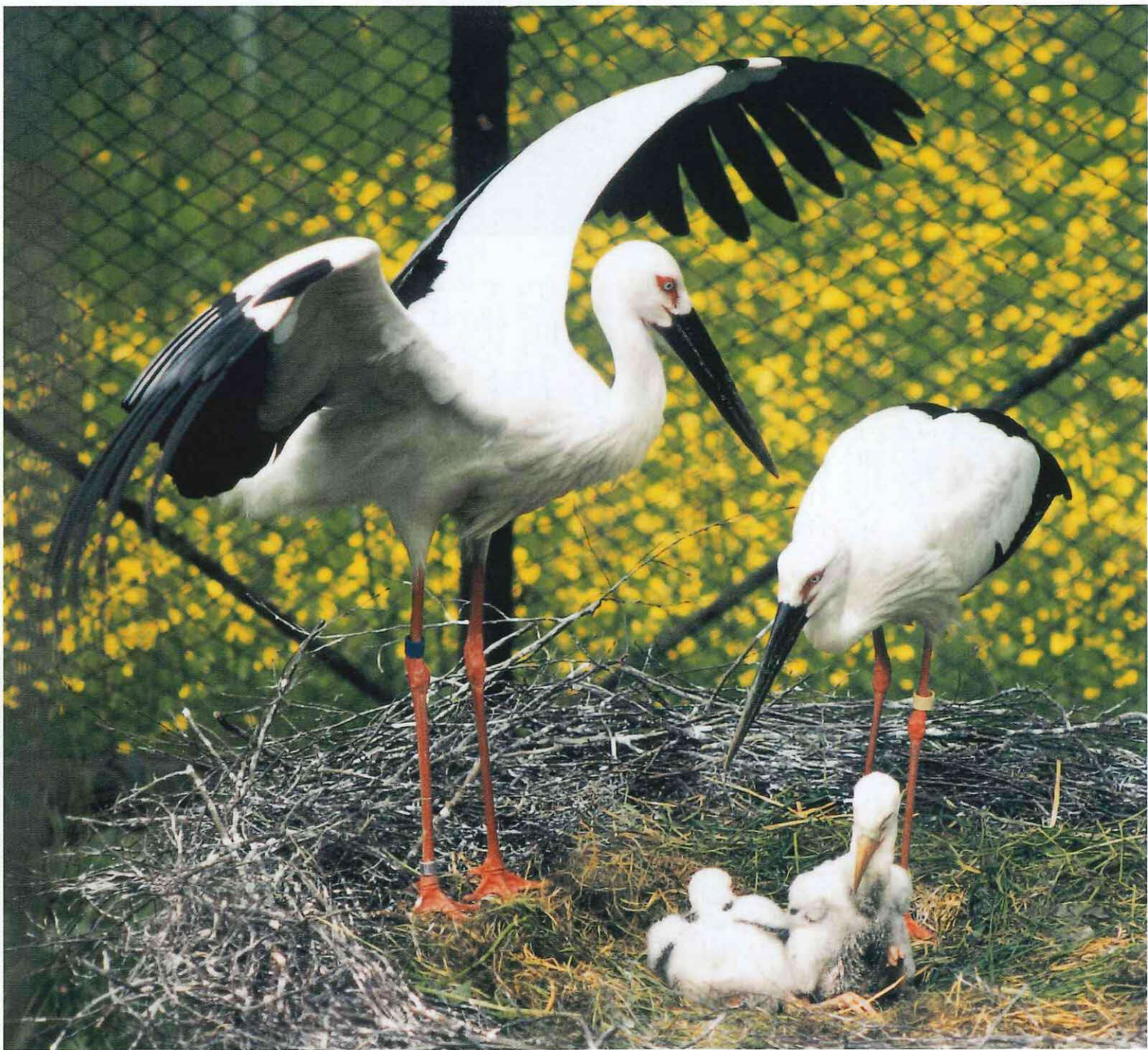
ここのとり(豊岡市)

時代の流れが、成長の時代から、多様な価値を尊重する成熟の時代へと移行する中、2001年という世紀の節目を迎え、新しい世紀の幕開けを祝うとともに、この21世紀の100年間に、私たちが愛する但馬をどうしていきたいのか、どういった但馬であってほしいのかなど、今一度立ち止まって、財産(人・海・森・里・空)を見つめなおし、次代へ引き継ぐべき財産を整理するとともに、新たに但馬の財産を創り、自信を持って「ふるさと・但馬」を多くの方々アピールする契機として「但馬21世紀記念事業」が但馬各地で実施されます。