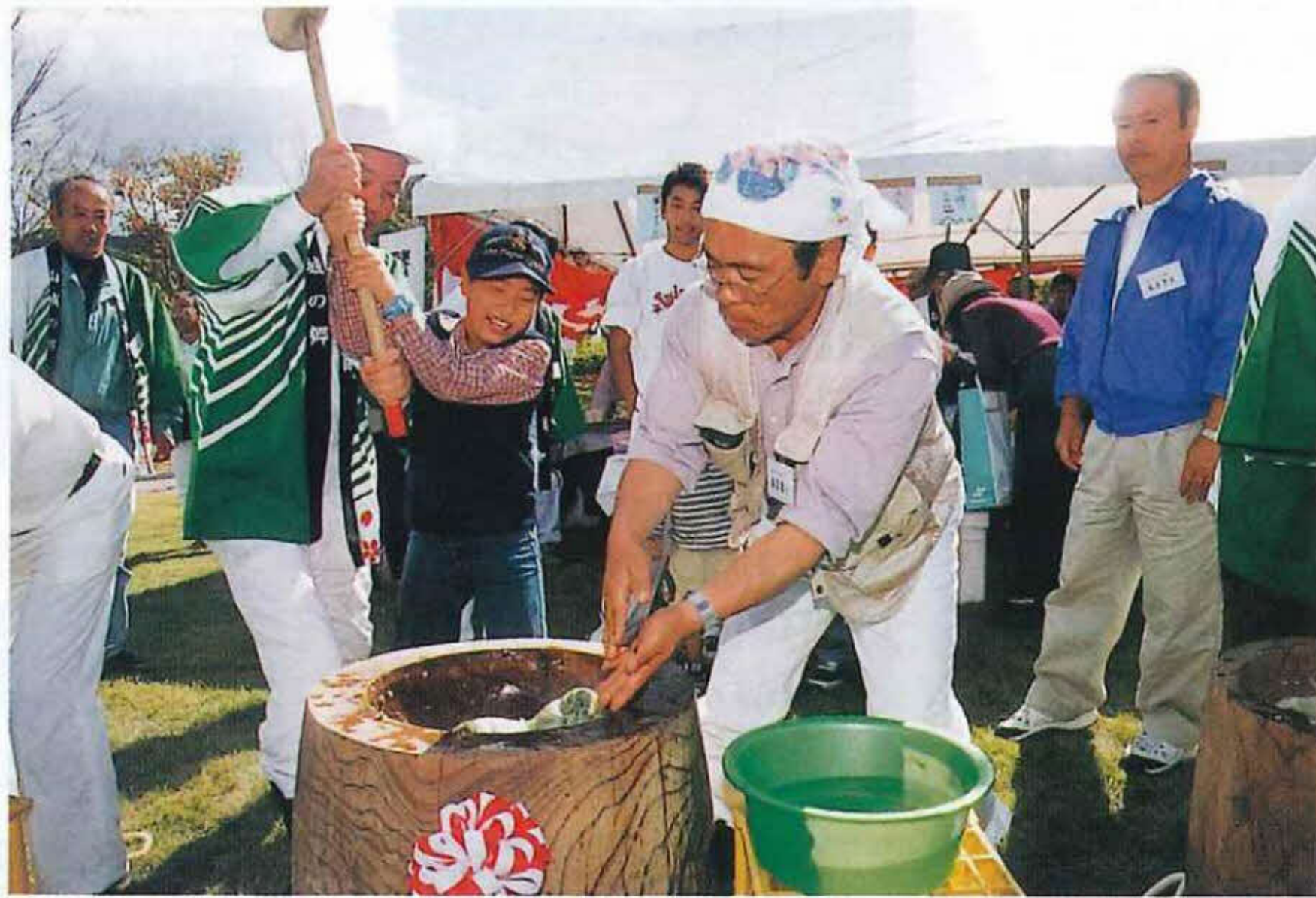
但馬・食文化まつり

●但馬・食文化まつり ・日時／秋(予定) ・場所／和田山町中央文化公園周辺 但馬を育み、但馬人を育んだ、但馬の食文化を21世紀へ伝えます。但馬の里の文化や味覚をPRします。 問／同実行委員会 TEL0796(72)3301