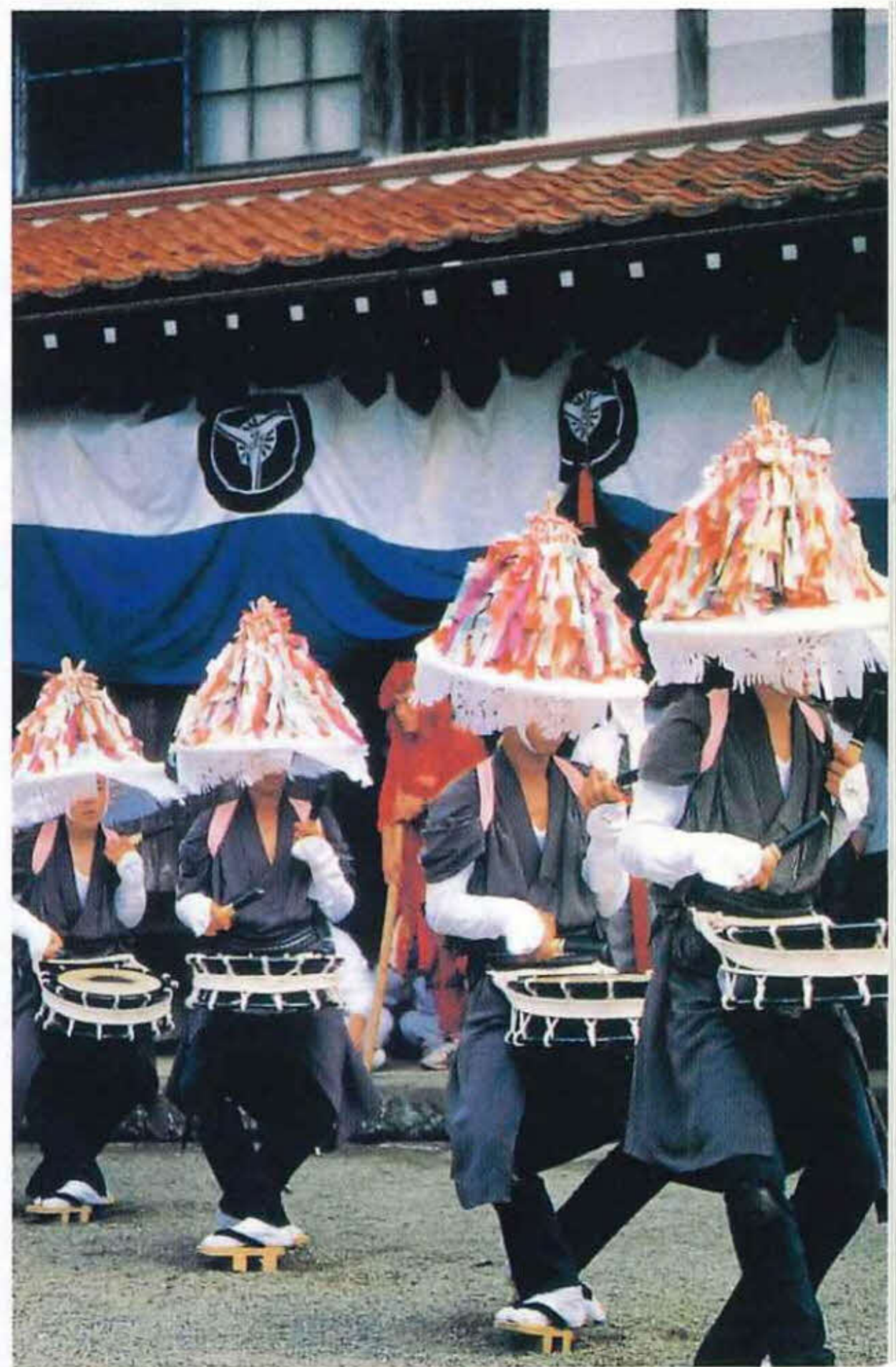
ざんざか踊り（浜坂町）

問／（財）但馬ふるさとづくり協会 兵庫県豊岡市山王町11-28 TEL0796(24)2247