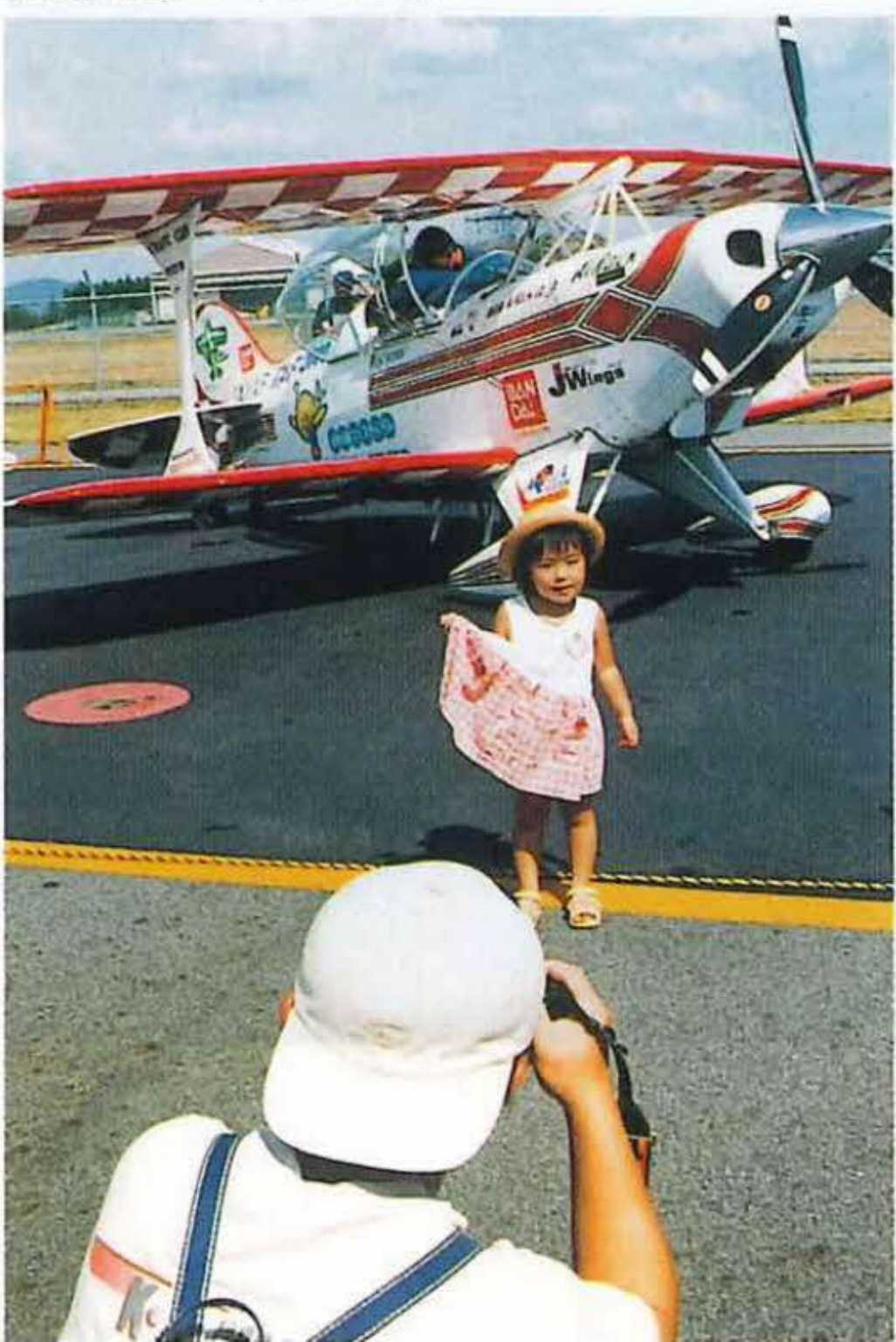
但馬空港フェスティバル