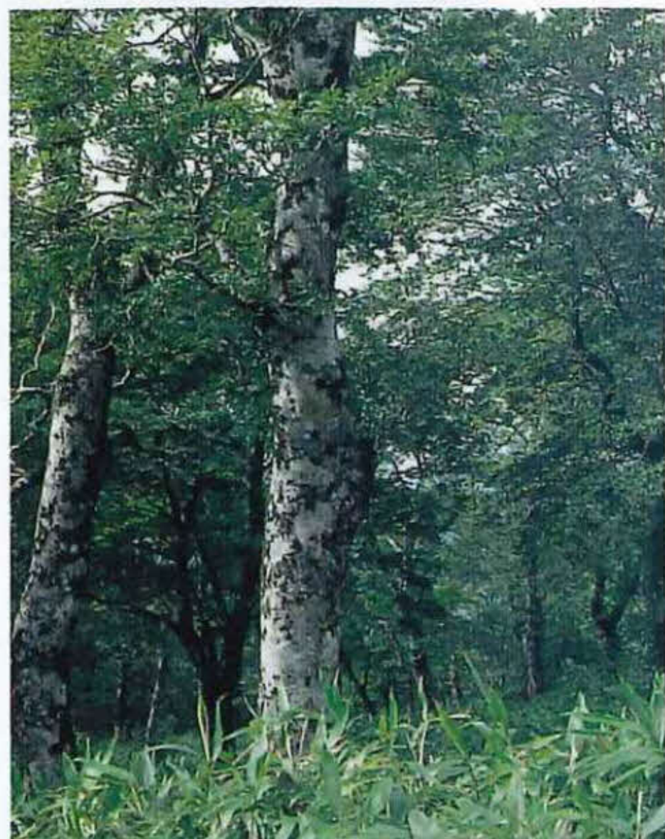
氷ノ山のブナ林（大屋町）