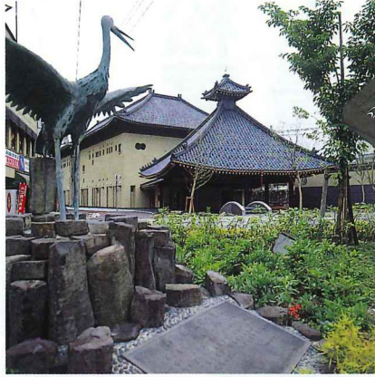
さとの湯の外観は温泉寺薬師堂をイメージした和風造り