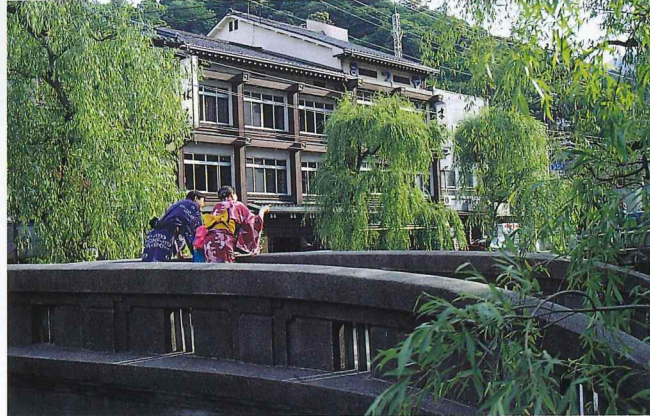
大鎗川にかかる太鼓橋に、緑の柳が風に揺れる。ゆかた姿がよく似合う。城崎温泉はぶらりそぞろ歩きができる温泉街として、他にはない風情を今に伝えている。