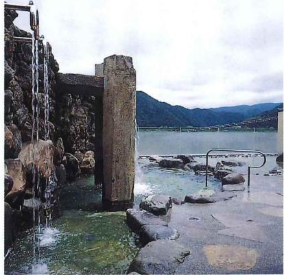
3階は、円山川が一望できる展望露天風呂がある