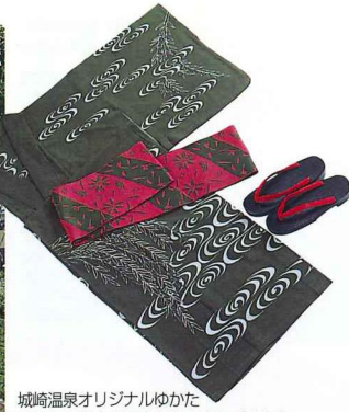
城崎温泉オリジナルゆかたゆかたの似合う温泉としてまちづくりをおこなっている