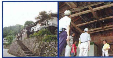
高い石垣の上に建てられている家