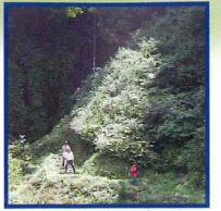
八反滝にも足をのぼして

の栽培にも盛んに取り組んでいる。また、起業家が多く、粘り強さが新屋の気質となっている。 新屋の人たちはよく、「ちよっと上の山まで行ってくる」という。かつて盛んに牛を放牧し、牧草を刈っていた山。広大な山林に豊かな自然、山には熊も生息する。時折、里へ降りてくることもあり、熊の道と呼ばれる歩くルートが決まっている。驚かせずに山に帰って行くのを見守る。昼間でもキツネや狸が人里によく姿を見せる。 現在は道路状況も良くなり、冬はスキー場となるミカタスノーパ