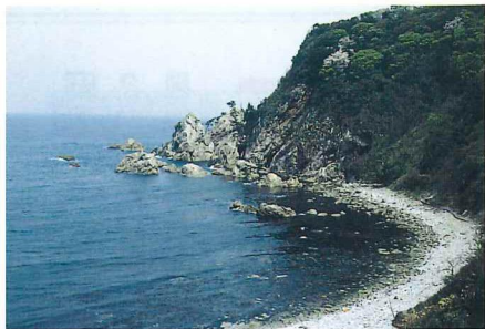
浜坂町田井の浜 海中公園1号