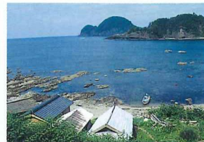
竹野町大浦湾の先が海中公園

に富み、これらの動植物が群生しているところでは、華麗であるとともに日常、目に触れることのできない神秘的な景観を見ることが出来ます。 海中公園の条件は ● 周辺の陸域、海域がともに国立公園または国定公園の区域として指定されており、かつ陸域の自然保護が十分はかれるものであること。 ● 海底地形に特色があり、海中動植物が豊富であること。 ● 海水が清く澄み、河川等により汚濁されるおそれが少ないこと。 ● 水深はおおよそ20m以浅を標準とする。 ● 潮流および波浪があまり激しくないこと。 ● 棧橋、休憩所、自然教室、駐車場等の陸上関連施設を設ける土地が周辺にあること。 ● 漁業との調整が可能であり、特に海中景観の保護について地元漁業関係者の協力が得られること。 ● その他、各種産業開発による景観破壊のおそれが少ないこと。 海中公園に指定されるということは、それだけで澄んだ海とすばらしい