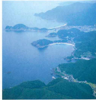
空から見た竹野海岸から猫崎半島。

日本を代表するにふさわしい優れた自然の景勝地として、環境庁長官が指定し、国が管理する「国立公園」は、昭和9年（1934）に初めて指定され、平成9年現在で28カ所となっています。