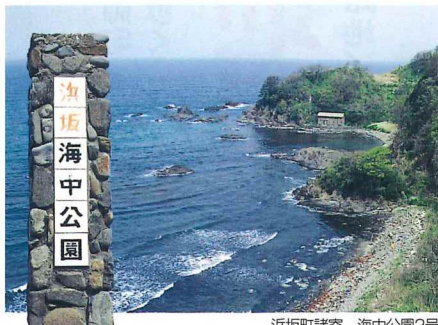
浜坂町諸寄 海中公園2号