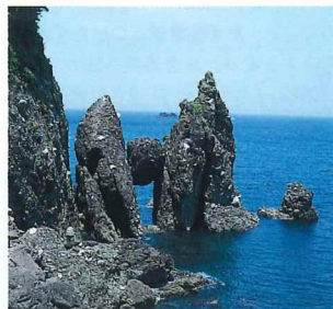
竹野町はさかり岩

竹野スノーケルセンターは6月4日(日)にリニューアルオープンします。大画面(ハイビジョン)による竹野町の四季などがリアルタイムで楽しめます。