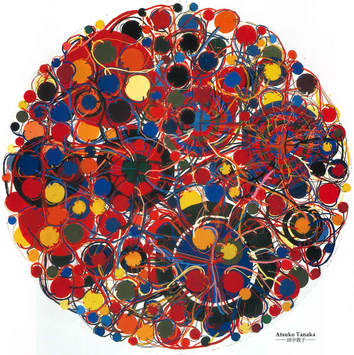
Atsuko Tanaka — 田中敦子 —