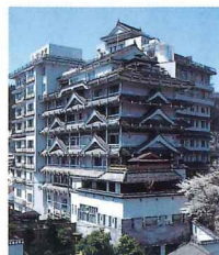
夢千代の里—湯村温泉

二〇〇〇年は心の贅沢を大切にしよう。夢のようなことだが、身近にあるような気がする。