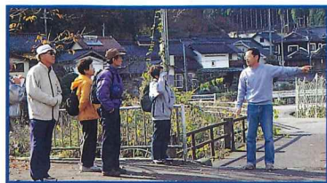
探険隊、天谷川を渡って筏の家並みに行く。

西谷地区の中心、大屋川・天谷川・佐治見川と3つの川が合流する地点にあり、山と養蚕で栄えてきた。大正時代から建てられた3階建ての養蚕農家が多く残り、独特の風情ある家並みをつくり出している。