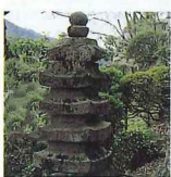
初代竹田城主 太田垣光影の墓碑