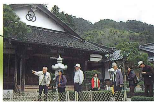
それぞれのお寺にまつわる話を聞く