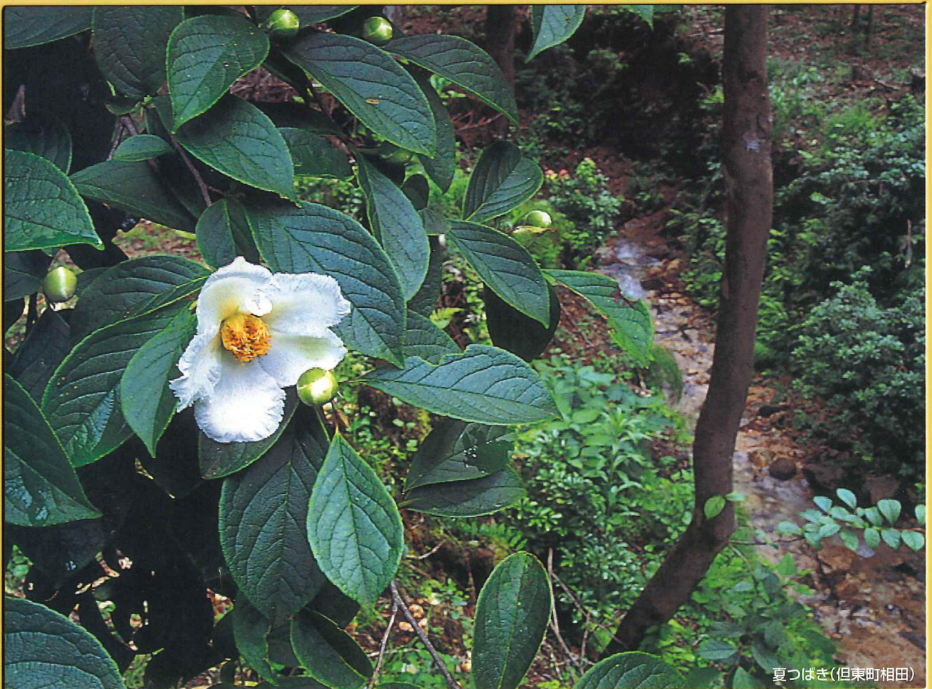
夏つばき(但東町相田)