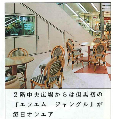
2階中央広場からは但馬初の『エフエム ジャングル』が毎日オンエア