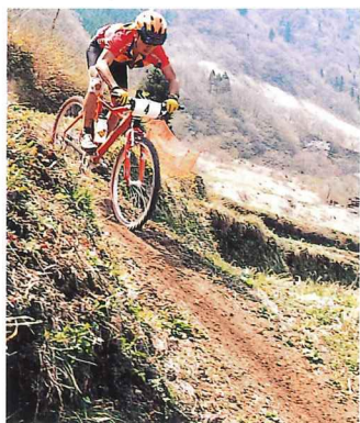
こんな急な坂もへっちゃら。すごいスピードで駆け抜けます。