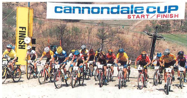
クロスカントリー部門のスタート。カラフルなコスチュームに身を包んだ選手達が、いっせいに飛び出します。氷ノ山の自然を満喫する6キロのコースを走り抜けました。クラスによって6キロの周回数が異なります。