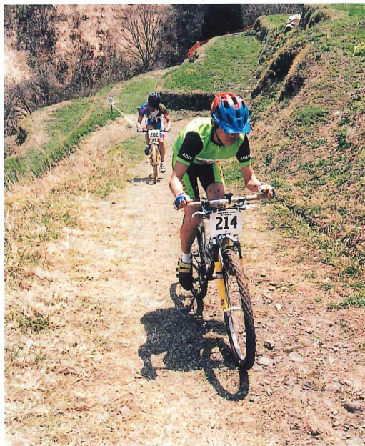
選手たちにおもしろいコースと絶賛をあげた氷ノ山国際のコース

うこともあります。大きなイベントをすれば良いともいえませんが、やはり、自分たちの手でやって、これからコツコツと下地をつくり、地元から徐々に盛り上げていきたいと考えています。「とにかく、続けることです」と、これから毎年関宮町ではマウンテンバイク大会を開き、広めていくのが夢です。まず、その一歩を踏み出したばかりです。