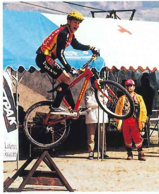
トライアル世界チャンピオンのリボルカラスさんの演技が披露されました。すばらしいジャンプや妙技に観客のみなさんは感嘆の声。マウンテンバイクも極めれば、ここまでできる！