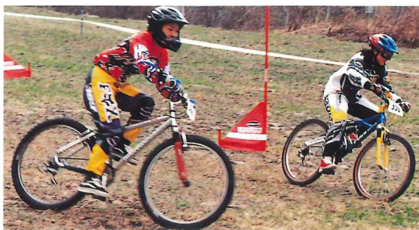
デュアルスラロームの熱戦の様子。2人が同時にスタートし、速くゴールした者が勝ち。ダウンヒルをやっている選手たちがスピードを競います。ダウンヒルは滑降的な競技で、クロスカントリーはマラソンのようなもの。それぞれにヘルメットやプロテクターも違い、選手もどちらかを専門としていて、区別がはっきりしているそうです。