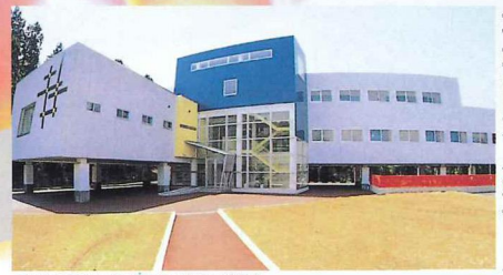
兵庫国際ビジネス専門学校