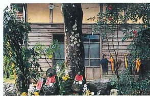
大師堂のおこもり堂。40年間前から書道教室の場としても活用されている。昔なつかしい趣が残されている。