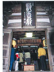
1月8日初薬師、6月第1日濯温泉まつり、7月20日祭り、11月8日仕舞薬師と年4回、法要と共に一般公開される。