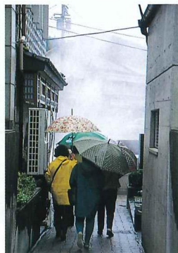
路地から荒湯へ狭い路地から望む荒湯のもうもうとした湯けむりは、異色のファンタジーポイントです。