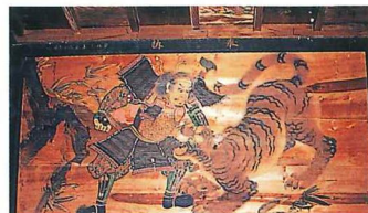
薬師堂の中に掲げられている8枚の絵の一枚、武者絵。天井板の一枚一枚にも動物、植物など色鮮やかな絵が描かれている。