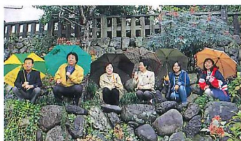
今回参加の探険隊員のみなさん。昔、相撲などがおこなわれていた棧敷席跡の石垣で観戦気分を味わう。