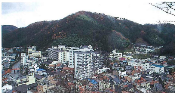
清正公園から一望した町並み

谷間の温泉町をVの字に横切るライン。坂道を降りたり登ったり、静かな佇まいの中に、温泉の御利益の信仰を伺わせる。