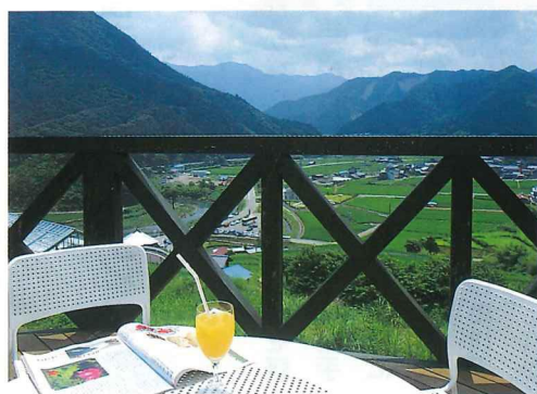
ペンション「翡翠」は都会的なリゾートの雰囲気いっぱい。テラスからは段々畑や大屋川、山々まで見渡せ、最高の眺め。