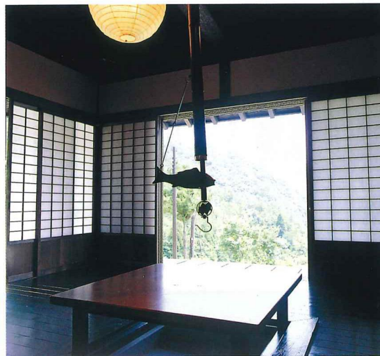
昔なつかしい民家風のコテージ。板の間には囲炉裏があり、障子をあげると緑豊かな山々を眺めることができる。グループ、家族連れに人気。

てやまぬものがあるようです。何と いっても家族連れが多いのも特徴で、 子供たちがワイワイと自分の手でさ わつて、つくって、体験できるのが大 きな魅力。これから、もつと農家の なのんびりとした雰囲気づくりをし ていきたいと考えています。