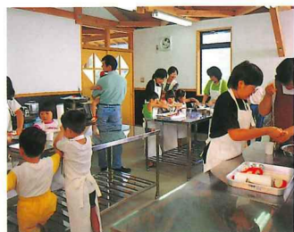
家族連れがたくさん参加している手造りウインナーの体験。ワイワイガヤガヤ、みんなとても楽しそう。新鮮な素材を使っているの、味の方も保証付き。お土産にも喜ばれるとか。