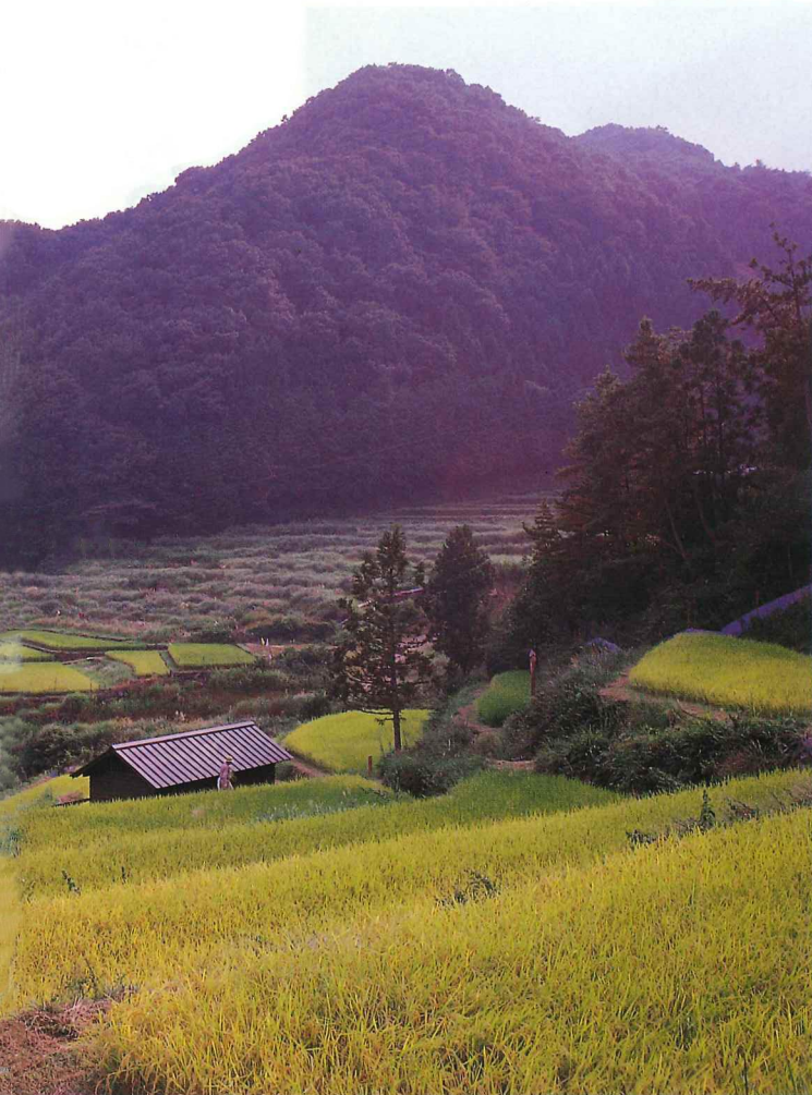
オーナーたちが植えた稲が大きく実り、重そうに頭を垂れている。稲刈りもみんなで行い、収穫を喜んだ。

体験工房では手打ちそばの体験ができる。真剣な眼差しの参加者たち。自分で打ったそばを食べるのも、また格別の味。