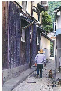
軒先がふれあうような行末