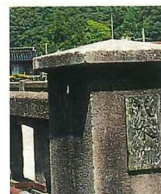
蛇紋岩で作られた新町の橋名板