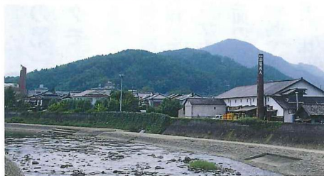
川向こうから眺めた風景。造り酒屋の長い煙突が象徴的。商店街の賑やかな町並みとは違った趣がある。

山陰線の開通後、町の中心部を流れる八木川に沿って発達した商店街の一角。大正ロマンの風情をただよわせる家並みを多く残す。