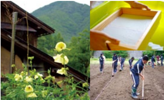
美しい紙をすくために、原料繊維を水中に1本1本むらなく分散させておく「花オクラ(トロロアオイ) ※材料のひとつ」。地区民と村岡高校生が畝づくり、タネ植えから栽培に協力している。