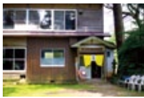
長須神社の隣にある紙すき小屋。高台から集落と矢田川が見降ろせる。