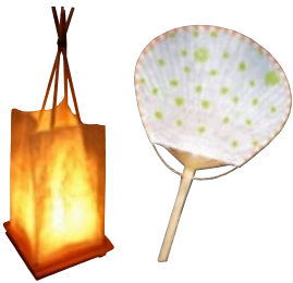
手すき和紙を使って作成した行灯とうちわ。