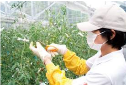
「固定概念にとらわれず、いろんなことにチャレンジしたい」との思いから、スタッフはあえて農業未経験者を起用。日々のデータをとり、勉強しながら野菜栽培に励んでいる。