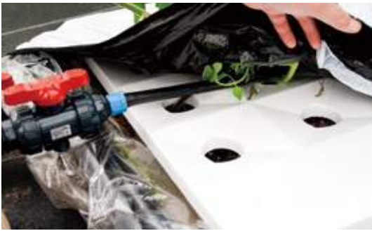
もともと医療用製品を展開する会社が開発した特殊なフィルムを使用する「アイメック農法」は、排液が出ないため環境にも優しい。

一般的なトマトに比べて糖度が2倍以上もあり、とても甘い。トマトが苦手な人でも食べることができたといううれしい声も。