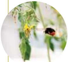
生産ハウス内にハチを飛ばし、受粉させている。

一般的なトマトに比べて糖度が2倍以上もあり、とても甘い。トマトが苦手な人でも食べることができたといううれしい声も。