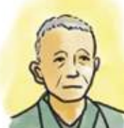
長 熙 Hiroshi Cho 1851 ~ 1911