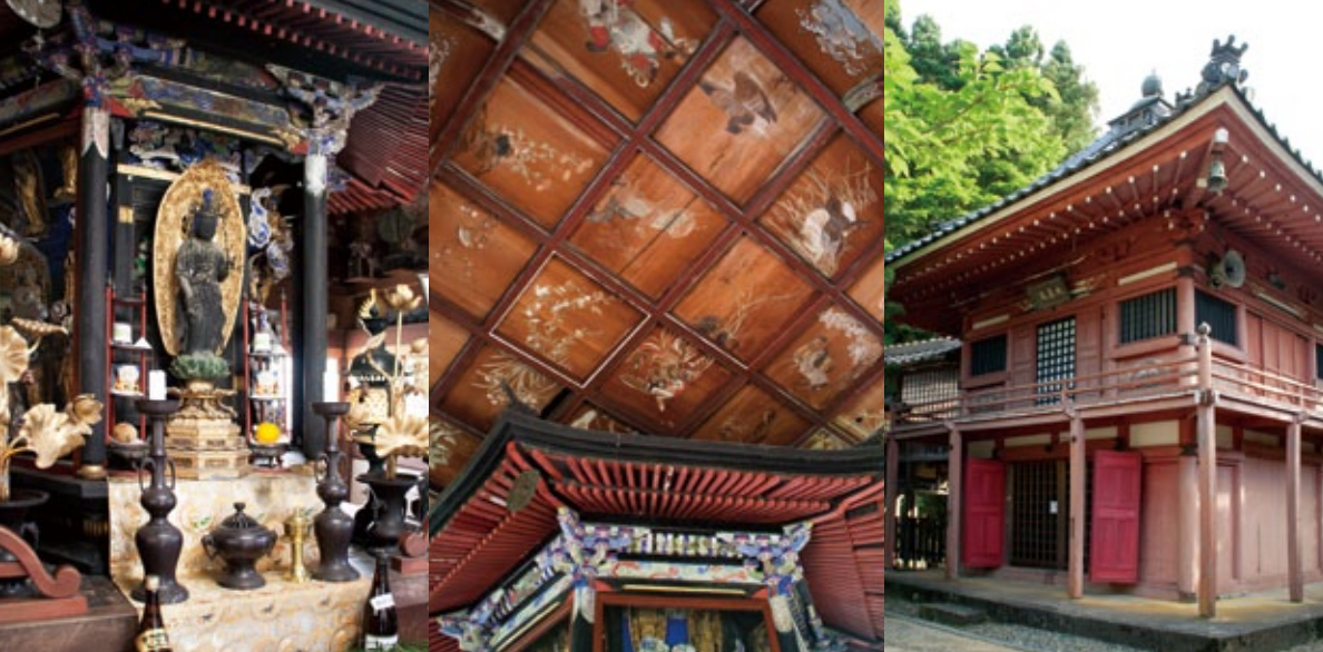
(左) 赤堂の2階の「多羅観音」。堂内には城崎の伝統工芸・麦わら細工の現存最古の作品や、日本最古のおみくじの本などもある。(中) 赤堂の天井画。四天王や天女、動物が描かれている。(右) 色鮮やかな紅で彩られた赤堂。1階には子供と安産の守り神である鬼子母神(きしもじん)、その夫とされる半支迦(はんしか) 大将とその子供たちが祀られている。鬼子母神の家族が祀られているため「家族を守る神様」、すなわち参拝者全てを守る神様として親しまれている。