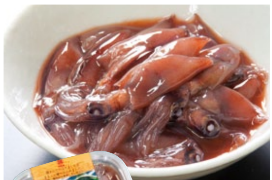
絶妙な塩辛さと、ホタルイカ独特の旨味が絶品。つつい箸がすすんでしまう。