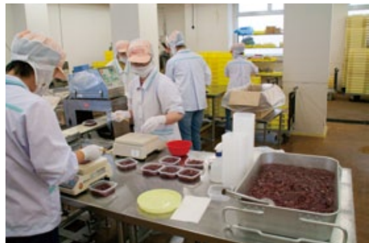
ホタルイカの充填作業。機械でつめられているイメージだが、全て手作業で丁寧に詰められており、見栄えも美しい。