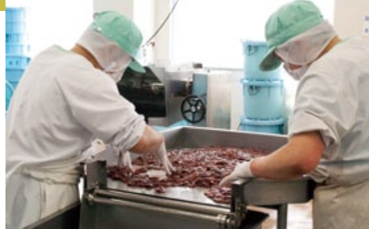
徹底した異物除去作業。機械だけでなく人の目でもしっかりとチェック

香住港から工場まで5分、柴山港からも30分以内と、前浜を持つ立地条件が同社最大の強み。水揚げしたばかりの新鮮な素材を短時間で搬入し、すぐに下処理され調味液へ浸す。鮮度の高い状態で浸すことで浸透率が高くなり、味はもちろんだ日もよくなるのだ。また、生産から消費までが明確に管理されたトレーサビリティによって安全性が確保されている。こうして、醤油漬けは、チルド状態で60日の賞味期限を保持することを可能とし、但馬産業大賞の「キラリと輝く技術部門」に輝いた。主力といえる商品は、その開発から完成に少なくとも3年を費やす。何百回と調味配合率を変え、一度市場に出した商品もお店と消費者の意見を取り入れ、改良を加える徹底ぶり。但馬の新鮮な素材とマルヨ食品のこだわりの賜物は、今日も全国の食卓に美味しい笑顔を届けている。