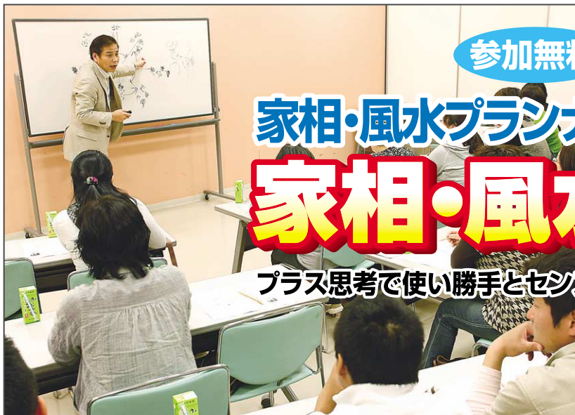
家相・風水の知恵を採り入れ、使い勝手とセンスの良い家をご提案(豊岡会場でのセミナー風景)