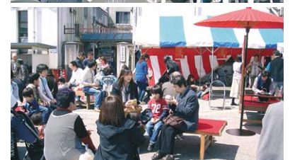
写真は昨年の豊岡菓子フェスタ