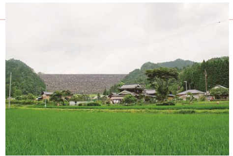
風力発電の風車が建つ黒川ダム。自然石を積み上げたロックフィルダムの壮大な風景が広がる。ダム湖には周回道があり、1周できる。