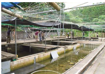
日本ハンザキ研究所では旧黒川小中学校のプールを利用して、河川改修工事の現場などで保護されたオオサンショウウオを一時飼育している。また、赤ちゃんを飼育展示している「ミニ・アクアリウム」やパネル展示のスペースもあり、無料で見学することが出来る。

オオサンショウウオが多数生息する清らかな川 山名氏ゆかりの寺や屏風のようにせり立つ巨岩 この秋は不思議がいっぱいの黒川へ出かけよう