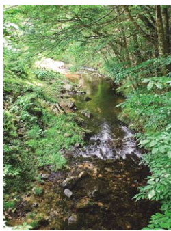
日吉神社の脇を流れる黒川。黒っぽい川底は、「黒川」の名にふさわしい。夏場はホタルが乱舞する。

市川には国の特別天然記念物であるオオサンショウウオが多数生息し、旧黒川小中学校を利用した調査・研究施設「NPO法人日本ハンザキ研究所」がある。「ハンザキ」とはかつての標準和名で、口が大きく、体が半分に裂けているように見えることから名が付けたという。研究所ではマイクロチップを挿