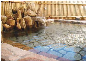
大明寺の花園から湧き出た黒川温泉は、美人の湯として知られている日帰り温泉施設。炭酸水素イオンを豊富に含む泉質で、肌かすべすべになるといふ。お食事処も併設している。毎週水曜休館。