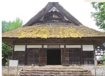
但馬守護・山名氏ゆかりの大明寺・開山堂。山名家・足利家の家紋の他、江戸時代は三代将軍・徳川家光より寺領を賜ったことから、築城も囃されている。開基した月庵和尚の自画自賛画像や徳川家代々の御朱印状など貴重な文化財が保管されている。