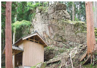
屏風のようにせり立つ巨大な1枚岩を御神体とする屏風神社。その昔、この岩が疫病の侵入を食い止めたという伝説が同地で伝えられている。周辺の木立では7月中旬頃にヒメボタルの幻想的な光を見ることが出来る。