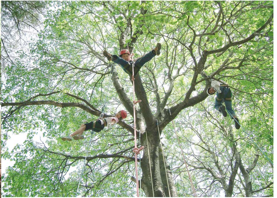
ふれあいの森ボランティア養成講座で行われた探鳥会(左上)。地元に住む89歳の林業作業士を招いて行われたチェンソーワーク(左下)では、里山文化継承にも一役買った。また、子どもたちにも自然に親しんでもらおうと、ツリーイング(上)の普及にも努めている。

人材育成に取り組むきっかけとなったのは、里山の荒廃だという。里山とは昔から薪や柴をとり、炭を焼いたり、生活に必要な様々な恵みを受けて人間が利用してきた森林のこと。