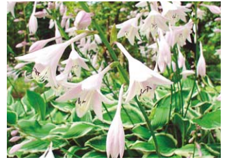
ユリ科の多年草・ギボウシ