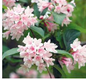
「田植え花」としても知られるタニウツギ