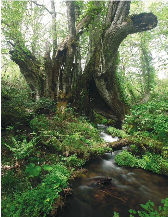
樹齢1,000年以上の和地の人カヅラから湧き出る「かつらの千年水」。水温1.0度、日量5,000トンの湧水によって約1,000種類の自生植物や高層湿原が生み出されている。