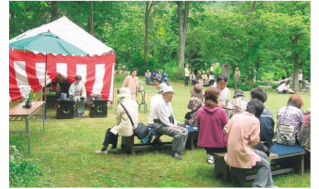
6月5日～13日までは恒例となったガーデンショーを開催。