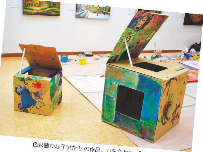
色彩豊かな子供たちの作品。力を合わせ、みんなで作り上げる。