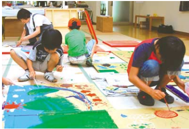
思い思いに筆を走らせる子供たち。「チャイルドアートキャンプ」では作品づくりを通して、友達との輪が広がる。