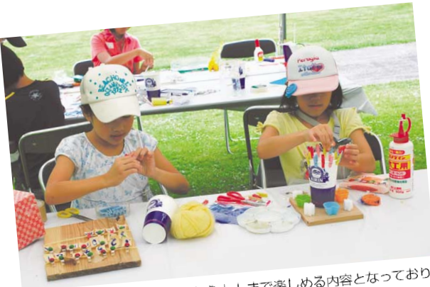
「アートDE遊ぼう」では子供から大人まで楽しめる内容となっており、親子で参加もできる。夏休みの思い出作りにぜひ！