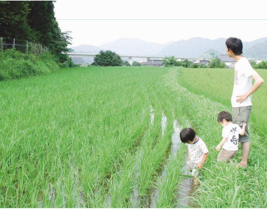
広々としたイロイロ米の田んぼ。

朝来市和田山町竹田。天空の城・竹田城の麓、山間に田畑が広がる一帯に、「ありがとんぼ農園」と名付けられた、少し変わった田んぼがある。植えられている稲の葉や茎を見ると、紫、茶など、見慣れない色が多い。