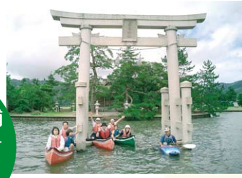
楽々浦をカヌーで巡ろう! 初心者でも参加できるカヌーツーリング。 *参加費 3,000円、親子2人1組は4,500円、10名程度