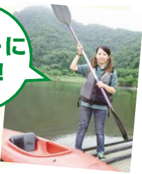
T2編集部Gが初挑戦! ドキドキ。