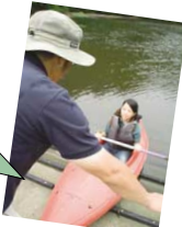
最終チェックをしていざ水の上へ!