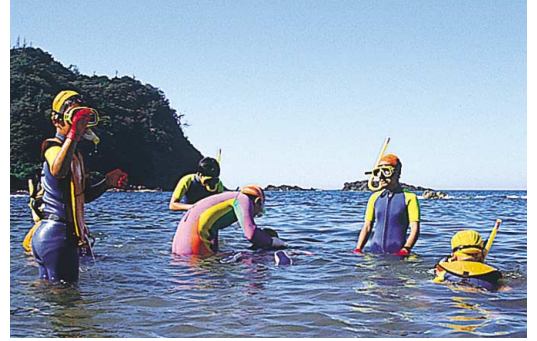
スノーケルや磯観察、漂着物調査などが体験できる環境教育体験