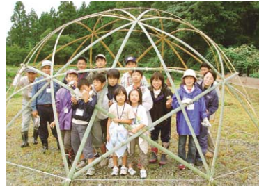
山から竹を切り出して、竹とヒモだけで作る竹ドーム作り。人きいもので、直径18メートルにもなる。