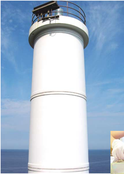
兵庫県の最北端、猫崎半島の灯台をめぐるツアーでは、朝日、夕日、漁り火が見える賀嶋公園など見所が多い。周辺は山陰海岸ジオパークの一部であり、貴重な地質遺産を見ることが出来る。