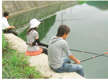
川の恵み体験では、地元の釣り名人の教えを受けながら、鮎やアマゴ釣り、カニかご漁などを楽しめる。