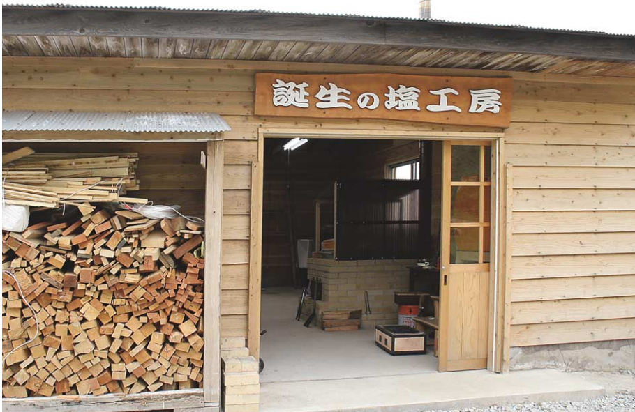
江戸時代、竹野は年貢を塩で納めたという。塩工房では日本海の海水から天然塩が作れる。もちろん火おこしも体験者が行う。