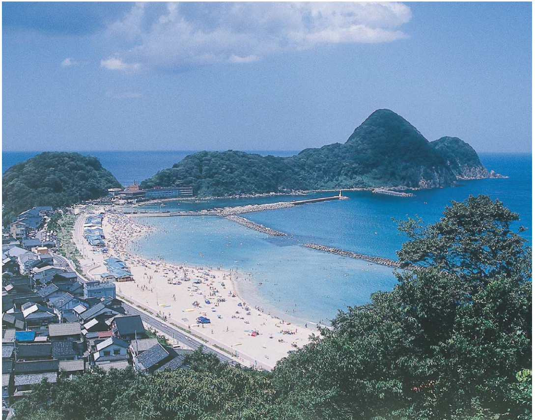
白い砂浜と遠浅で透明度が高い竹野浜は、日本の快水浴場にも選ばれている。江戸～明治時代には北前船の寄港地として栄えた場所としても知られている。