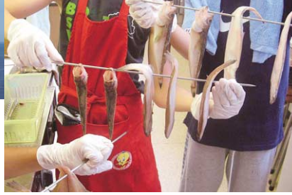
塩工房で作られた天然塩、地元で揚がる新鮮魚只で調理する干物作り。できあがったものは持ち帰ることができる。串の刺し方ひとつでも奥が深いのだとか。