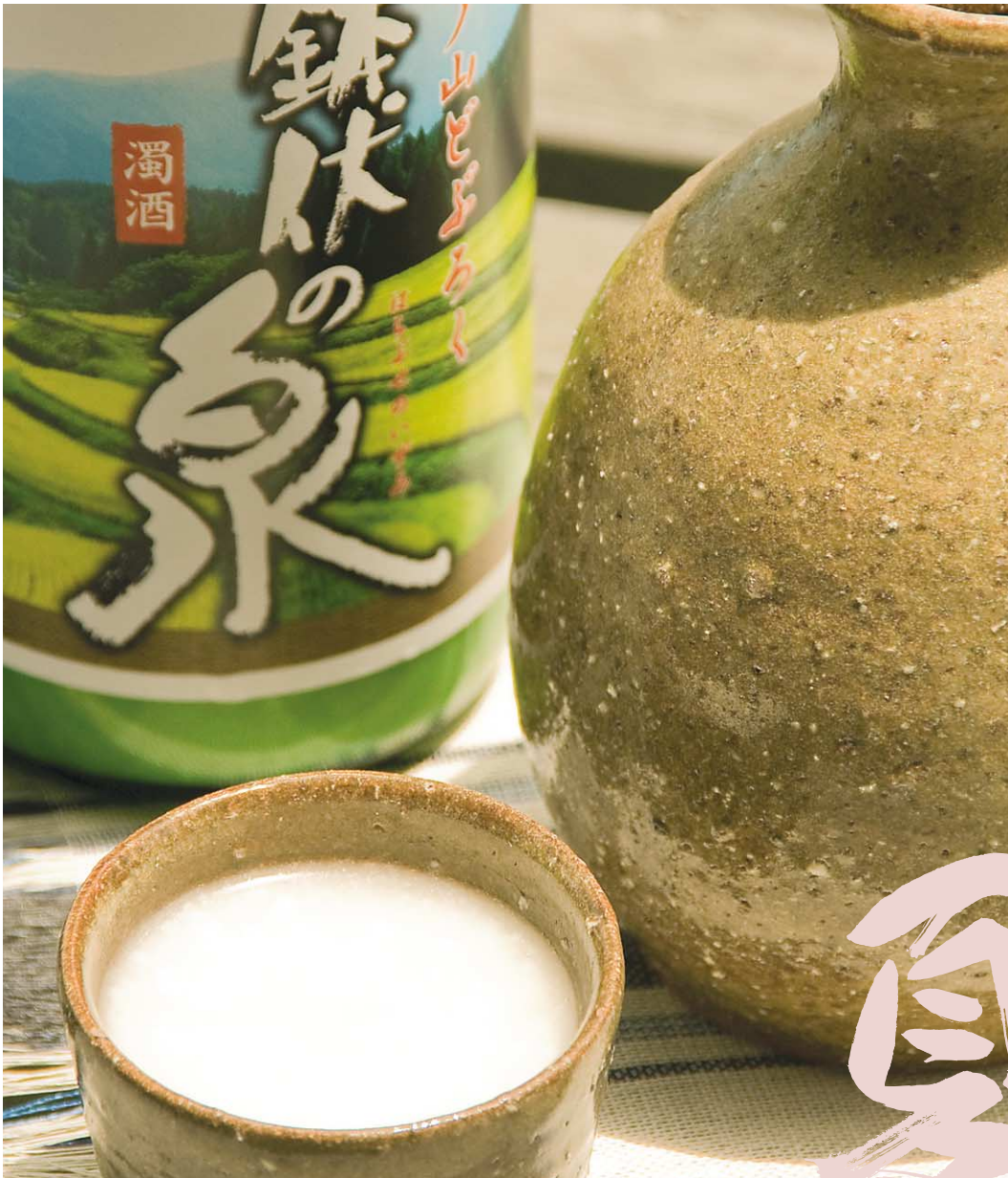
*取材協力：翠山荘（水ノ山どぶろく「鉢伏の泉」）