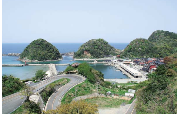
国道178号・七坂八峠から居組の町を望む。夏はイカ釣り漁船の漁り火が灯り、絶好の撮影スポットとなる。不動山(左)と亀山(右)は、村のシンボルとなっている。