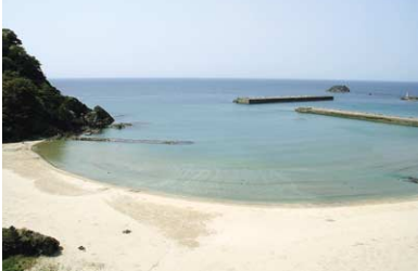
漁港の西側に広がる居組サンビーチ。現在の漁港一帯は遠浅の砂浜が続く海水浴場だったが、昭和45年の改修工事により、西の人戸の浜にビーチが新たに設けられた。

漁港の北にある「不動山」には「綱掛」という地名があり、船に係留した石杭の跡が今も佇んでいる。大型漁船に対応すべく、昭和