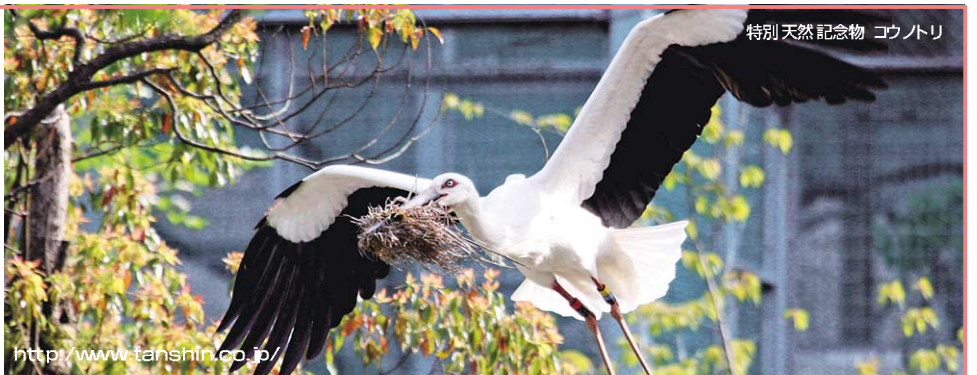
特別天然記念物 コウノトリ