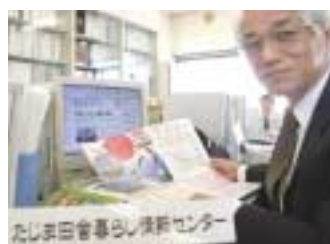
但馬出身の相談員がお答えします

但馬での生活をお考えの方、興味をお持ちの方、但馬出身の相談員が、田舎での暮らしを取り巻く生活環境から地域の風習、イベントなど但馬についてのハテナにお答えします!