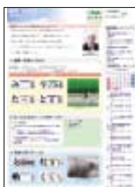
ホームページ「但馬情報特急」満喫!田舎暮らし

*情報発信…ホームページ「但馬情報特急」を活用した情報発信(田舎暮らしモデルメニュー、体験ガイド、支援制度の紹介等)